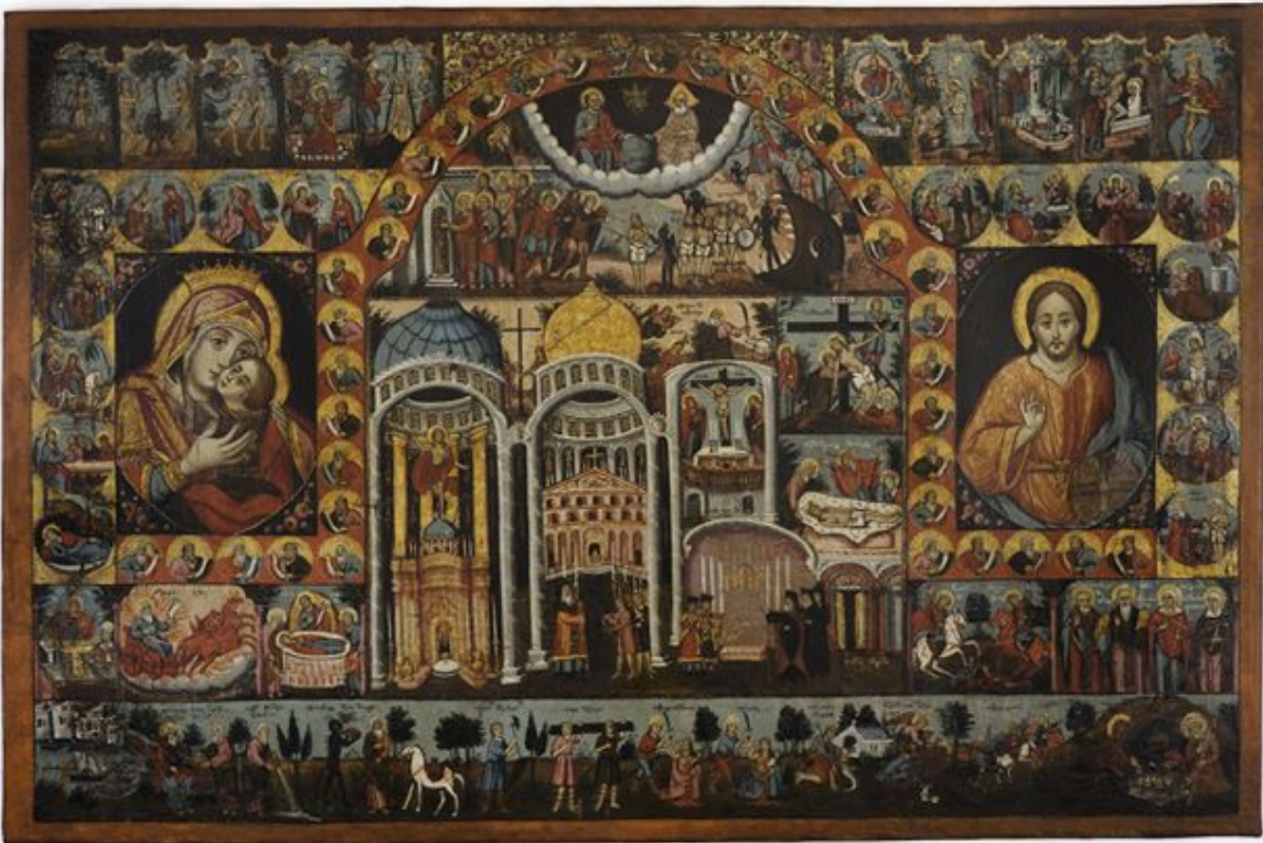
Προσκνητάριο των Αγίων Τόπων, 19ος αι, ΒΧΜ 22608

Παράλληλα, παρουσιάζεται -ως ένα από τα νεότερα παραδείγματα προσκνηματικού ταξιδιού- η περιοδεία-προσκύνημα του Γεωργίου Λαμπάκη στους Αγίους Τόπους, το 1905. Ο Γεώργιος Λαμπάκης συνέλεξε μεταξύ άλλων, ορισμένα αντικείμενα (μαρμαροθετήματα δαπέδων, χώμα από τον ναό του Τιμίου Σταυρού, τριμμένο υπόχρισμα από τον τάφο της Αγίας Άννας στη Γεθσημανή, φύλλα ελιάς από το Όρος των Ελαιών κ.ά.), τα οποία ενέταξε στη συλλογή της Χριστιανικής Αρχαιολογικής Εταιρείας.