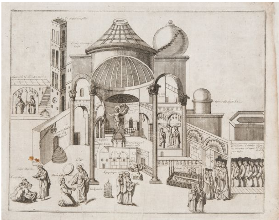
Ο Ναός της Αναστάσεως, καθ' ύψος τομή και ανάπτυξη των προσκυνημάτων, 18ος αι, ΒΧΜ 18826

Η Αγία Πόλις Ιερουσαλήμ, είναι ο βασικός προορισμός του μακρινού ταξιδιού, στην οποία βρίσκεται το σημαντικότερο προσκύνημα και το κατεξοχήν λατρευτικό μνημείο του χριστιανισμού: το σύνθετο και πολύπλοκο κτιριακό συγκρότημα του ναού της Αναστάσεως, με το πλήθος των επιμέρους προσκυνημάτων.