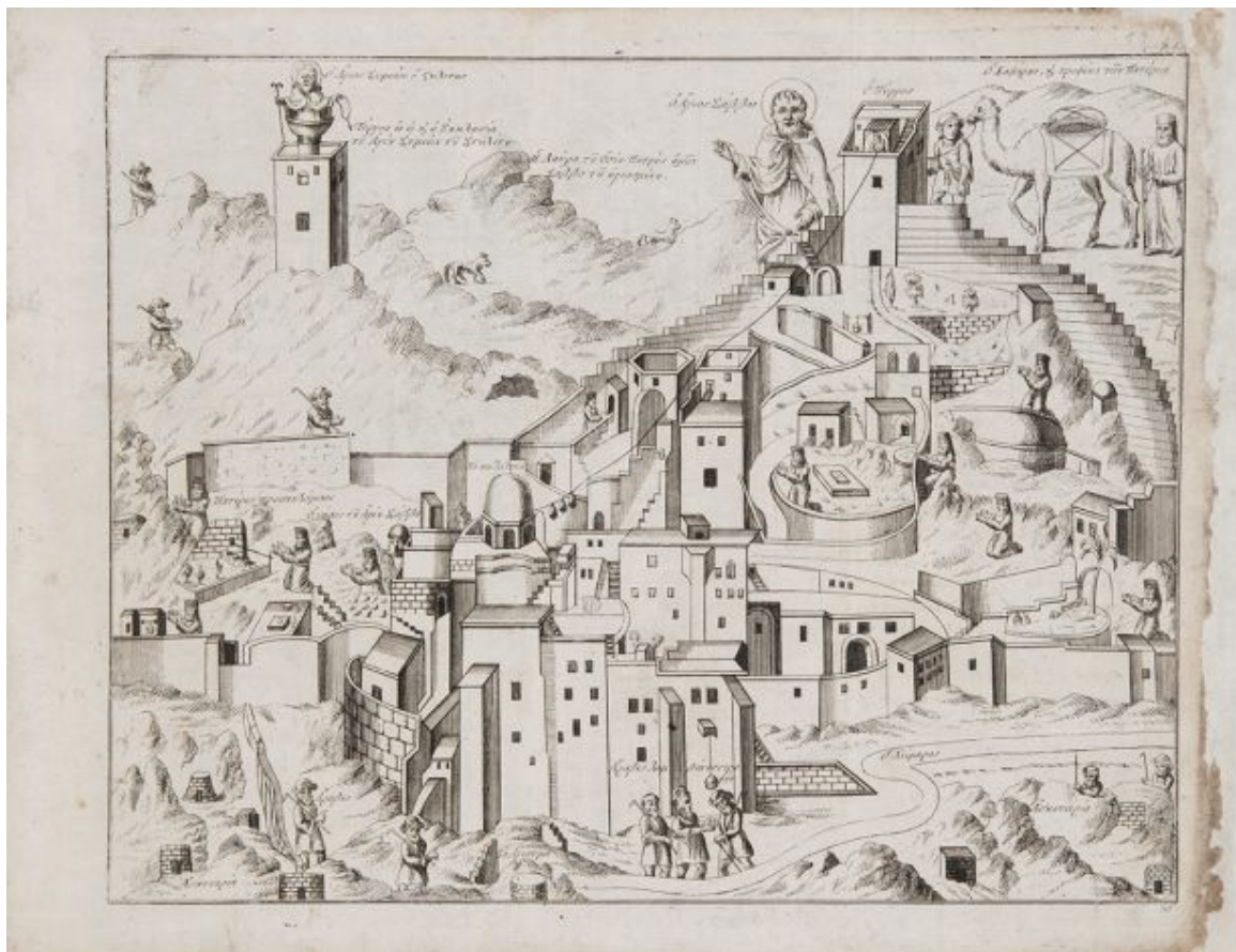
Η Μονή του Αγίου Σάββα, μεταξύ Βηθλεέμ και Νεκράς Θάλασσας και σκηνές από το βίο ασκητών και μοναχών, 18ος αι, ΒΧΜ 18841

Το ταξίδι στους Αγίους Τόπους προβάλλεται μέσα από τα χειρόγραφα και έντυπα, εικονογραφημένα, προσκυνητάρια των Αγίων Τόπων, τους ταξιδιωτικούς δηλαδή οδηγούς, οι οποίοι απευθύνονται στους Ορθόδοξους χριστιανούς και παρέχουν πληροφορίες για τους σταθμούς του επίγειου βίου και του πάθους του Χριστού.