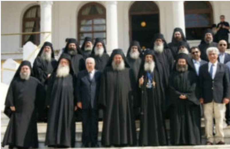
Από την αλλαγή της Ιεράς επιστασίας, την 14η/1η Ιουνίου 2011.