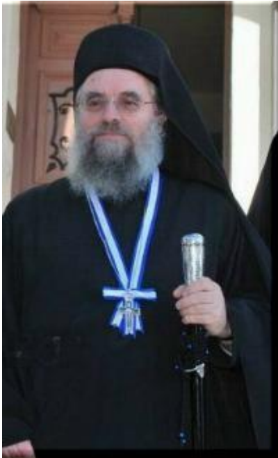
Ο απερχόμενος Πρωτεπιστάτης Γέρων Παύλος Λαυριώτης