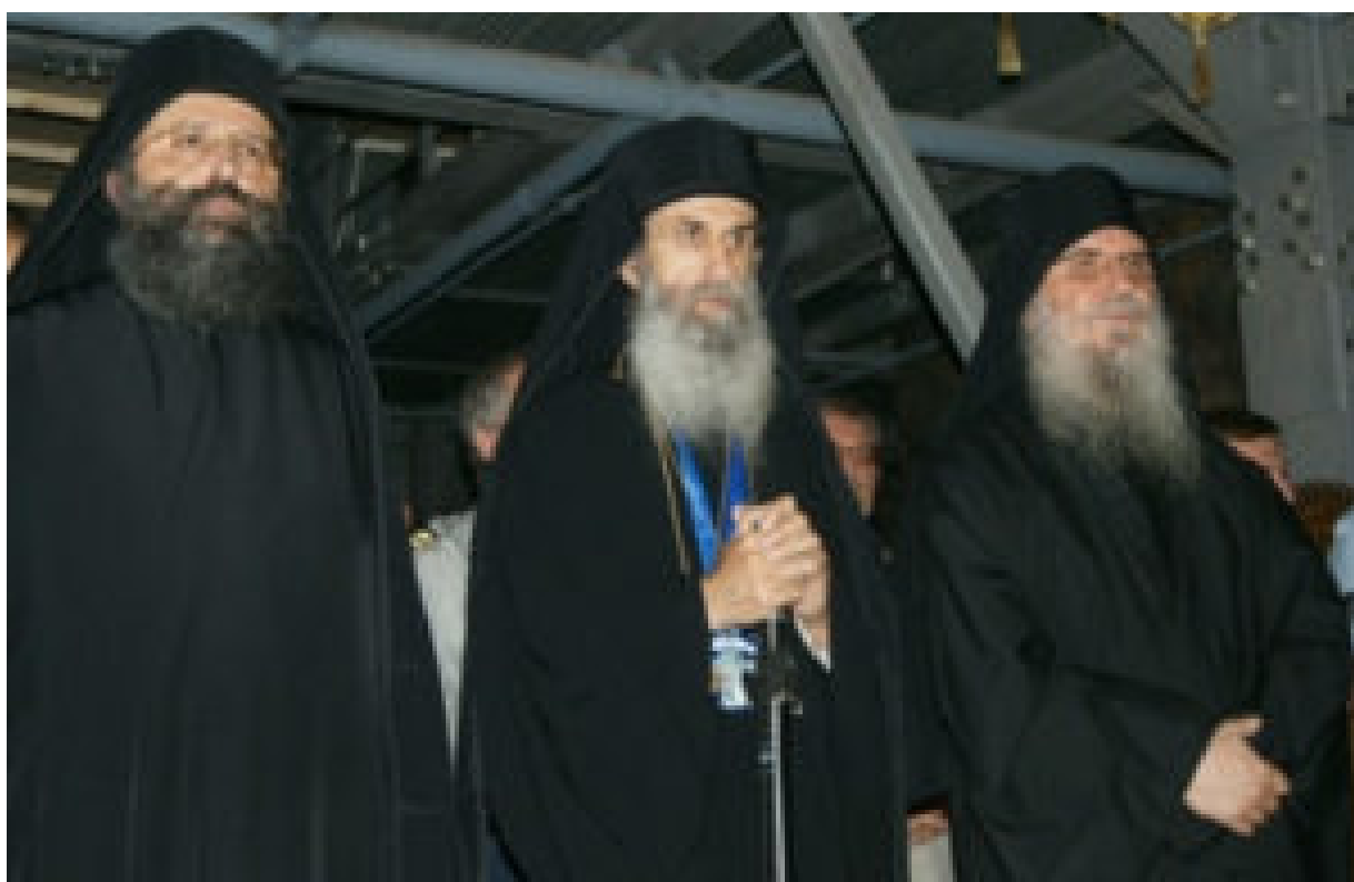
Από την αλλαγή της Ιεράς επιστασίας, την 14η/1η Ιουνίου 2011.