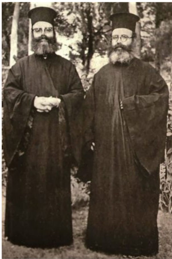
Ο άγιος Φιλούμενος και ο αδελφός του όσιος Γέροντας Ελπίδιος

Ευχαριστούμε, λοιπόν, τον μακαριστό πατέρα Μιχαήλ, που υπηρέτησε το μέγα Μυστήριο της Θείας Λειτουργίας. Ευχαριστούμε και τον νεωκόρο Κυριακό του παπά Ηράκλη, στον οποίο κάποτε χάρισε ο εξάδελφός του, ο άγιος Φιλούμενος, ένα ρολόι, το οποίο μου έδειχνε με καμάρι και μου έλεγε· «Αυτό είναι το ρολόι, που μου έδωσε δώρο ο ανεψιός μου, ο άγιος Φιλούμενος!» Αυτό το ρολόι θα το τοποθετήσουμε σ' αυτό τον χώρο, τον οίκο του αγίου Φιλουμένου, για να βλέπουμε ότι υπάρχει και άλλος χρόνος, ο χρόνος της αιωνιότητας, που οι άγιοι άνθρωποι του Θεού υπηρέτησαν. Εύχομαι κι εμείς να τους ακολουθούμε και να τους ευχαριστούμε, ενωμένοι με ένα στόμα και μία καρδιά.