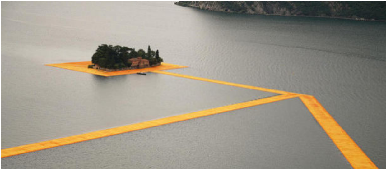
The Floating Piers

Ο Christo δημιουργεί μία πλωτή διαδρομή πάνω στη λίμνη Ιζέο της Ιταλίας.