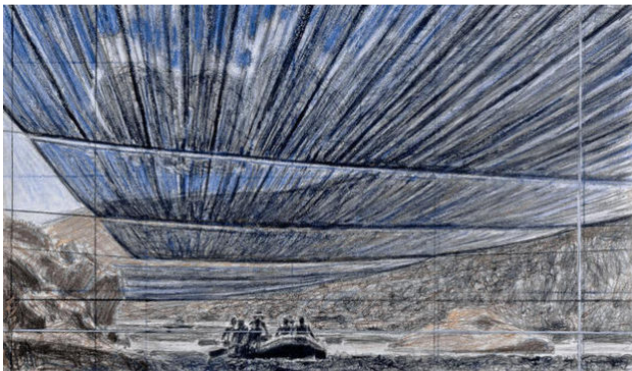
Over The River