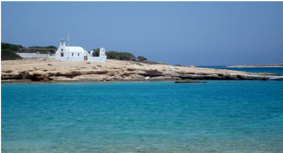
Κάτω Κουφονήσι

Τα Κουφονήσια είναι ένα μικρό σύμπλεγμα δύο μικρών νησιών ανατολικά της Νάξου και δυτικά της Αμοργού, στην καρδιά μιας ευρύτερης περιοχής που στο έδαφός της έχουν βρεθεί κατά καιρούς, σημαντικά ευρήματα κυκλαδικής τέχνης.