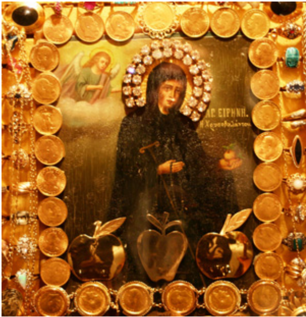
Η θαυματουργική εικόνα της Αγίας Ειρήνης Χρυσοβαλάντου στην Αστόρια της Νέας Υόρκης.