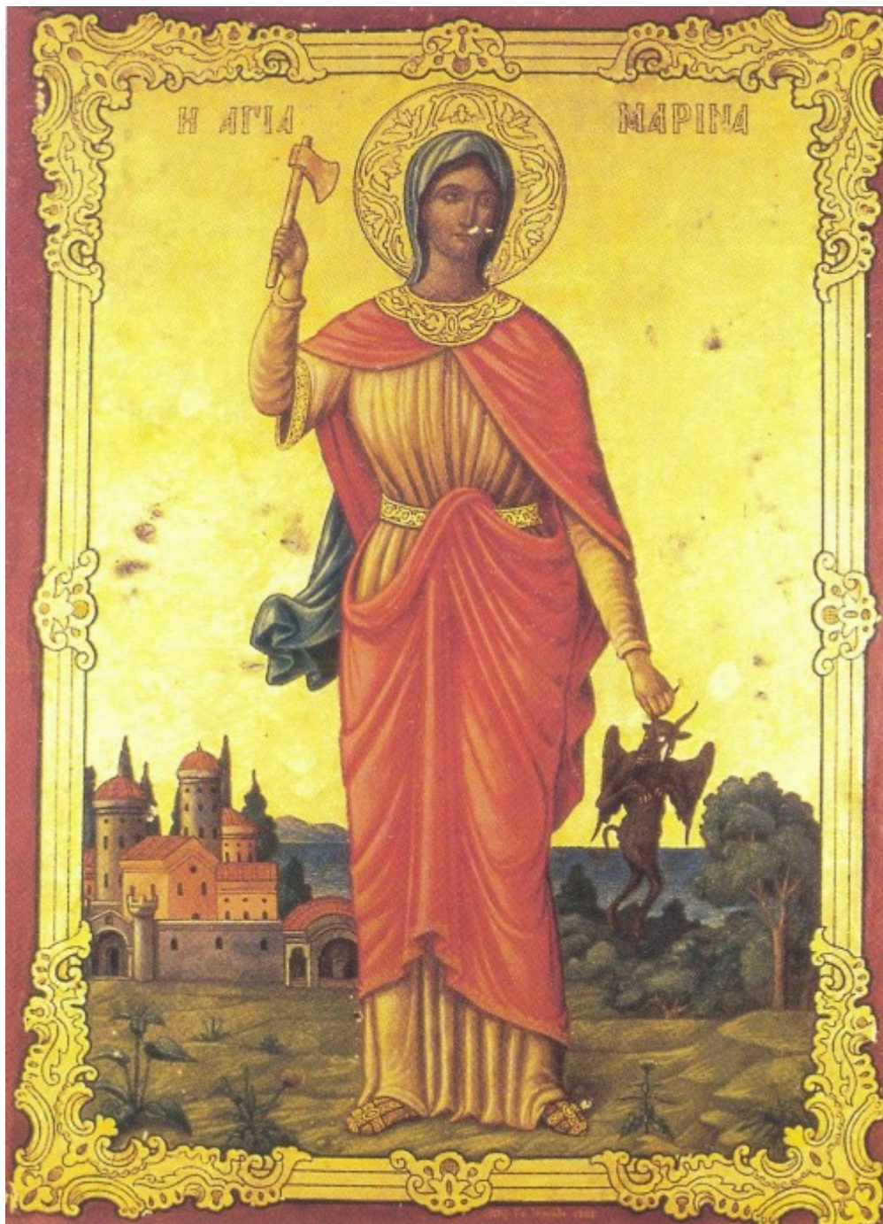
Η παλαιά εφέστια εικόνα της Αγίας Μαρίας από τον ναόν του Θησείου χωρίς το σφυρήλατο, χρυσό κάλυμμα της

«Μέγα το κατόρθωμα τό σόν, μέγα και πανάριστον όντως, σου τό εκνίκημα φύσις γαρ ευπτόητος και ευταπεινώτος, τον άόρατον δράκοντα, το όρος το μέγα, νουν τόν πολυμήχανον, Μαρίνα σύ αληθώς, είλες ευτελής ώς στρουθίον, και καταπατούσα χορεύεις, νυν μετά Αγγέλων αξιάγαστε.»