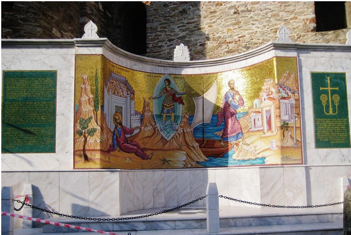
Το μνημείο που ανεγέρθηκε έξω από τον Ιερό Ναό του Αγίου Νικολάου, όπου σύμφωνα με την Ιερή Παράδοση, πάτησε για πρώτη φορά το πόδι του στην Ευρώπη, ο Απόστολος Παύλος.

Αξίζει να σημειωθεί ότι (σύμφωνα με πληροφορίες του http://www.kavala-portal.gr/ ), σε όλες τις άλλες υποψηφιότητες που είχαν εξεταστεί νωρίτερα, χρειάστηκε να καταθέσουν τις εισηγήσεις τους (ορισμένες φορές ακόμα και αρνητικές ή με πολλές παρατηρήσεις) και όλα τα μέλη της επιτροπής, τα οποία προέρχονταν από είκοσι χώρες.