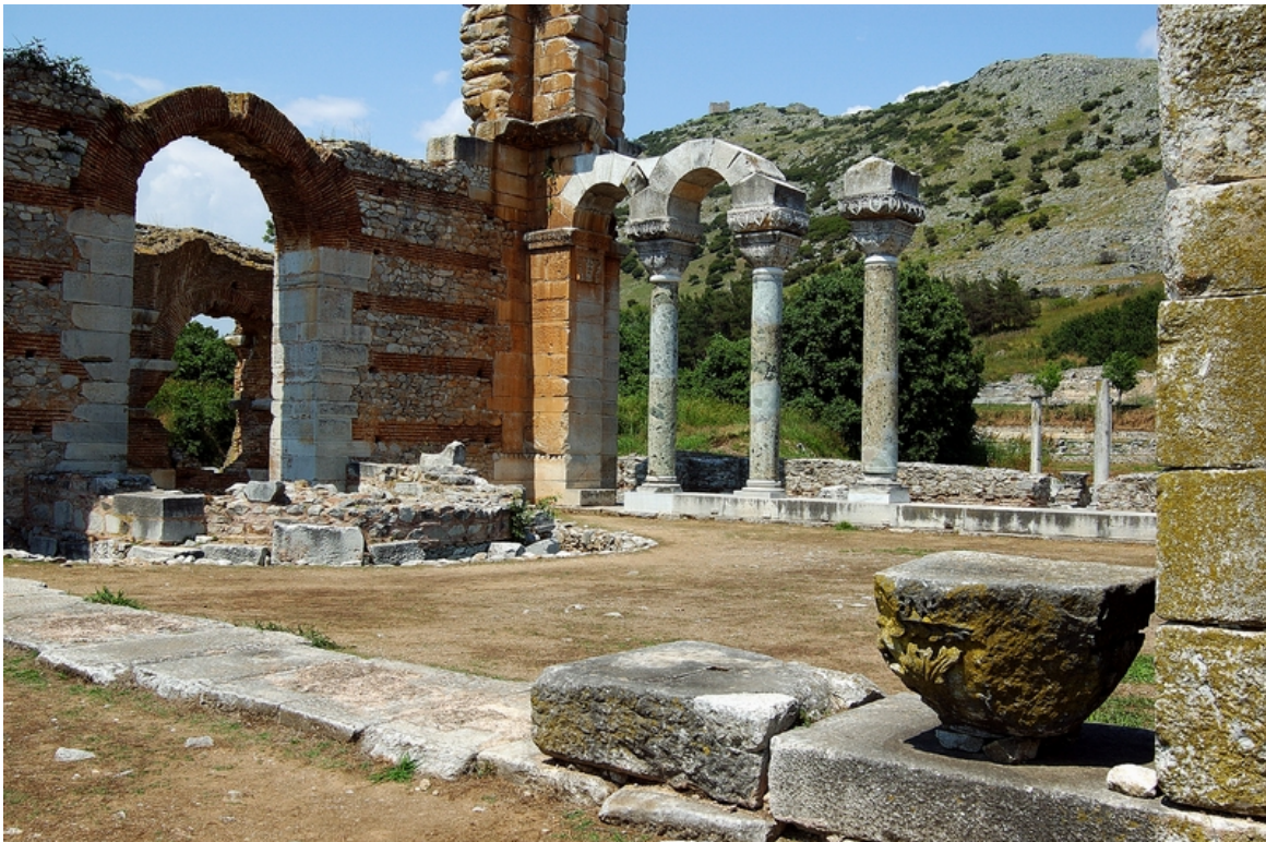
Ο Αρχαιολογικός Χώρος των Φιλίππων

Η εκτελούσα χρέη προέδρου της αρμόδιας επιτροπής της UNESCO Lale Ülker, εισηγήθηκε την πρόταση στο συνέδριο του Διεθνούς Οργανισμού, στην Κωνσταντινούπολη, αποσπώντας την απόλυτη ομοφωνία.