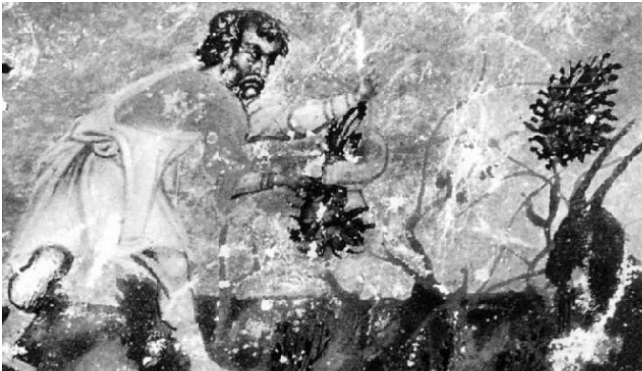
Κλαδευτήρι. Άγιον Όρος, μονή Βατοπεδίου

Η κατανάλωση του σιροπιού σε μακροχρόνια βάση είχε καταστρεπτικές επιπτώσεις στην υγεία, επειδή προκαλούσε μολυβδίαση, δηλαδή δηλητηρίαση από μόλυβδο. Πρόκειται για ασθένεια που παλιά εμφανιζόταν στους τυπογράφους, τους ζωγράφους, τους μεταλλοτεχνίτες-φαναρτζήδες, καλαϊτζήδες, καζαντζήδες, χρυσοκούς: σε όσους, δηλαδή, λόγω επαγγέλματος, είχαν καθημερινή επαφή με το μόλυβδο και τις ενώσεις του.