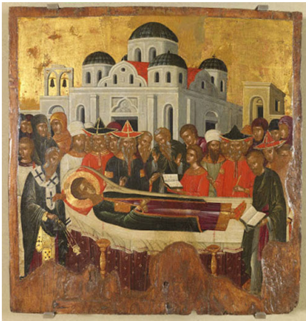
Η κοίμηση του Αγίου Δημητρίου. Μπροστά στο σκήνωμα του αγίου, πρωτοψάλτες με επίσημη ενδυμασία. (Φορητή εικόνα των μέσων του 16ου αιώνας, Βενετία, Ελληνικό Ινστιτούτο).