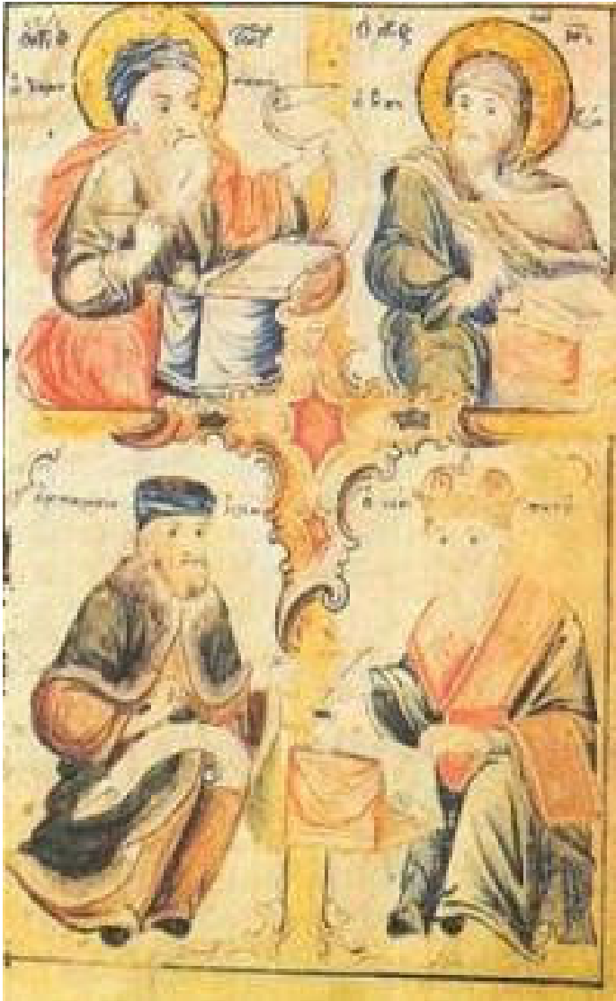
Οι Βυζαντινοί μελουργοί Ιωάννης Δαμασκηνός και Ιωάννης ο Κουκουζέλης και οι μεταβυζαντινοί Μπαλάσιος ιερέας και Γερμανός επίσκοπος Νέων Πατρών (Μικρογραφία σε «Ανθολογία της Παπαδικής». Χειρόγραφο Μεγίστης Λαύρας αρ. Θ178, έτους 1815)

Η μουσική παρακαταθήκη των μεγάλων μελουργών του ΙΔ΄ αιώνας, που κυρίως αφορούσε στη διαμόρφωση της λεγομένης καλοφωνίας ή στη μελική επένδυση γενικότερα των ψαλμών του Δαβίδ (που συνιστούν και το σταθερό ρεπερτόριο του εκκλησιαστικού νυχθημέρου, οροθετώντας ταυτόχρονα το παπαδικό γένος μελών της ψαλτικής), δημιούργησε απaráμιλλα φωνητικά μνημεία, ανυπέρβλητου