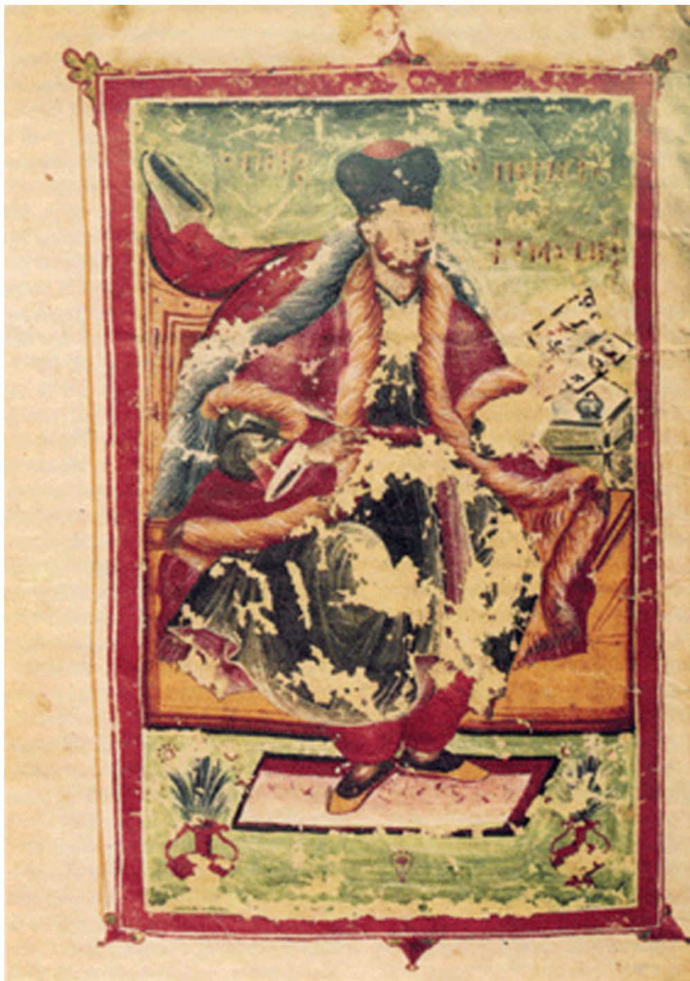
Ο μελουργός Πέτρος Μπερεκέτη, από τους κυριότερους εκπροσώπους της αναγέννησης του 17ου αι., συνέβαλε σημαντικά στη διαμόρφωση του Καλοφωνικού Ειρμολογίου. (Μικρογραφία στο χειρόγραφο αρ. 302 της Μονής Ξηροποτάμου, 18ου αι.

Το μεγάλο «ξέσπασμα», η αναγέννηση της βυζαντινής μελοποιίας συντελείται στο δεύτερο μισό του ΙΖ΄ αιώνας, με τη δεύτερη τώρα μεγάλη τετρανδρία των μελουργών Παναγιώτου του νέου, Χρυσάφη και πρωτοψάλτου, Γερμανού επισκόπου Νέων Πατρών, Μπαλασίου ιερέως και νομοφύλακος και Πέτρου Μπερεκέτη του μελωδού. Η μελοποίηση τόσο του Στιχηραρίου όσο του του Αναστασιματαρίου απο