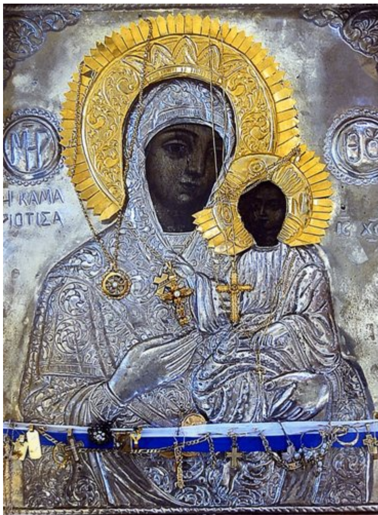
Παναγία η Εικονίστρια στη Σκιάθο