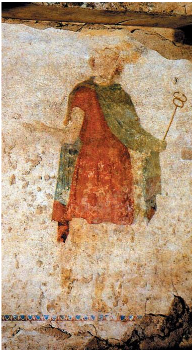
Ο Ερμής Ψυχοπομπός από τον Τάφο της Κρίσεως.