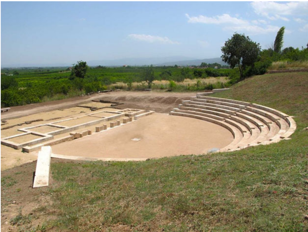
Το θέατρο της αρχαίας Μιέζας.

Από την Τετάρτη 20 Ιουλίου, το κοινό έχει τη δυνατότητα να επισκέπτεται με δωρεάν είσοδο και σε εκτενές ωράριο λειτουργίας ορισμένα από τα σημαντικότερα μνημεία της περιοχής της Νάουσας.