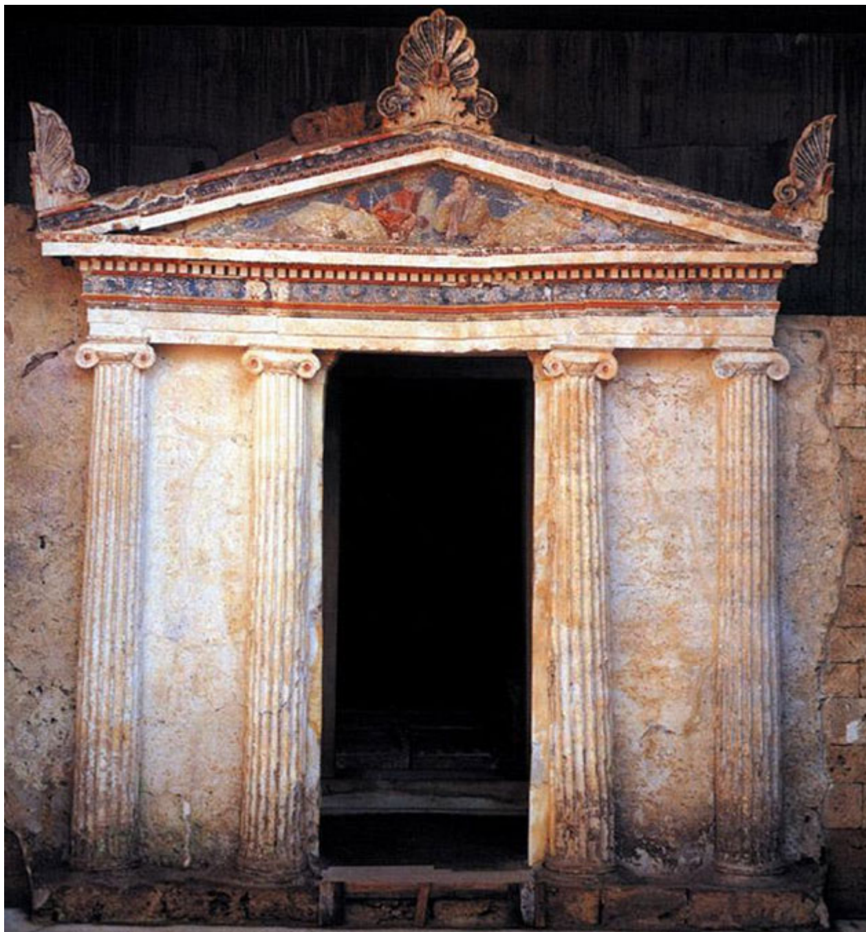
Η πρόσοψη του Τάφου των Ανθεμίων.