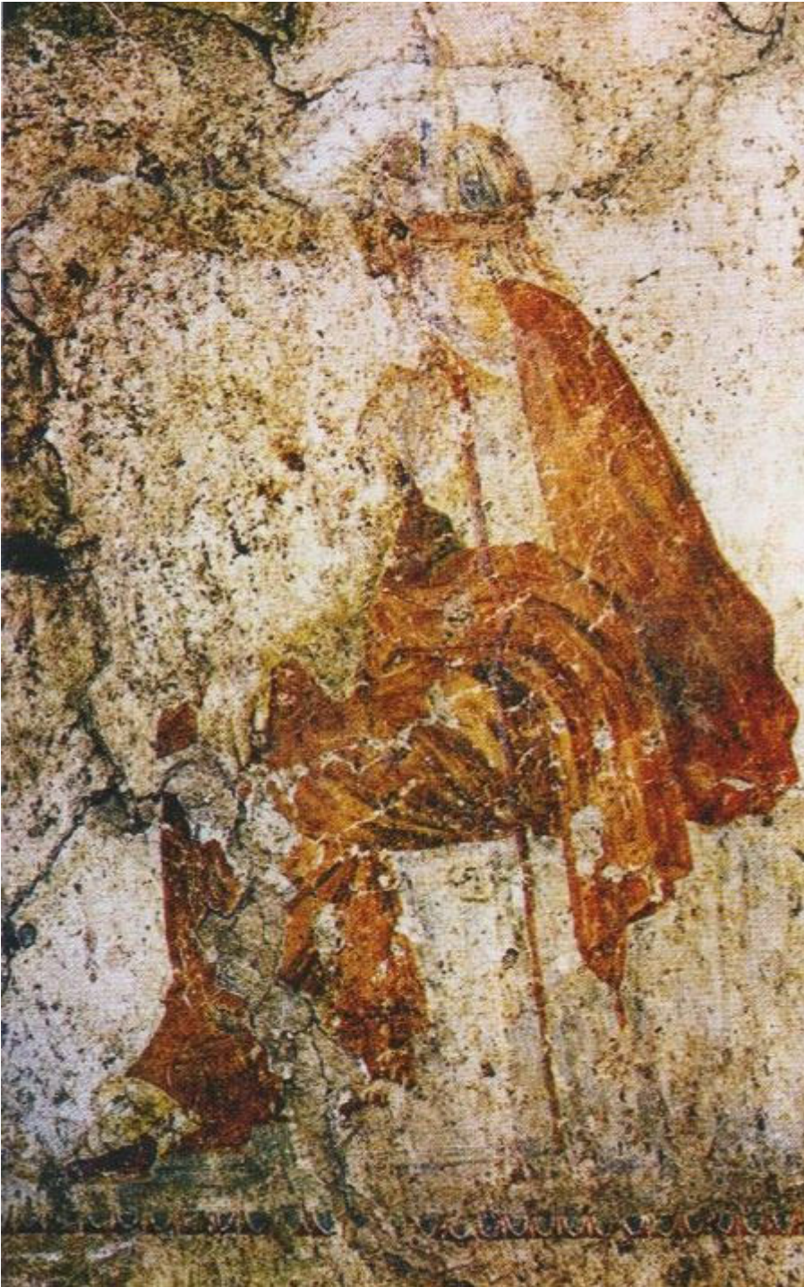
Ο κριτής Αιακός, που αποφασίζει για την τύχη του νεκρού, αν δηλαδή θα σταλεί στο νησί των Μακάρων ή στα Τάρταρα. Λεπτομέρεια από τον Τάφο της Κρίσεως.