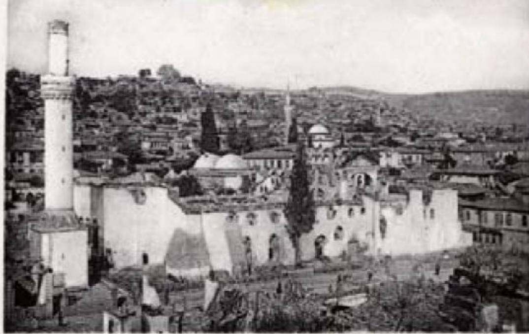
700 Paris n° 3218 27 SALONIQUE. — Saint-Dimitri après l'Incendie.

Ο ναός του αγίου Δημητρίου μετά την πυρκαγιά.