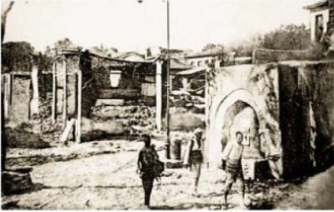
Η κρήνη Χορχόρ-σου μετά την πυρκαγιά.

Ήταν μεσημέρι Σαββάτου 5 Αυγούστου 1917. Η μέρα ήταν ζεστή και ο βαρδάρης που φύσαγε σαν τρελός έσπρωχνε τις φλόγες προς την πόλη. Οι κατασκευές και οι ξυλοδεσιές ήταν ξερές από το καυτό και άνυδρο καλοκαίρι. Τα σπίτια καίγονταν το ένα μετά το άλλο με εκπληκτική ταχύτητα. Σε λίγη ώρα το κακό μαινόταν εκτός ελέγχου.