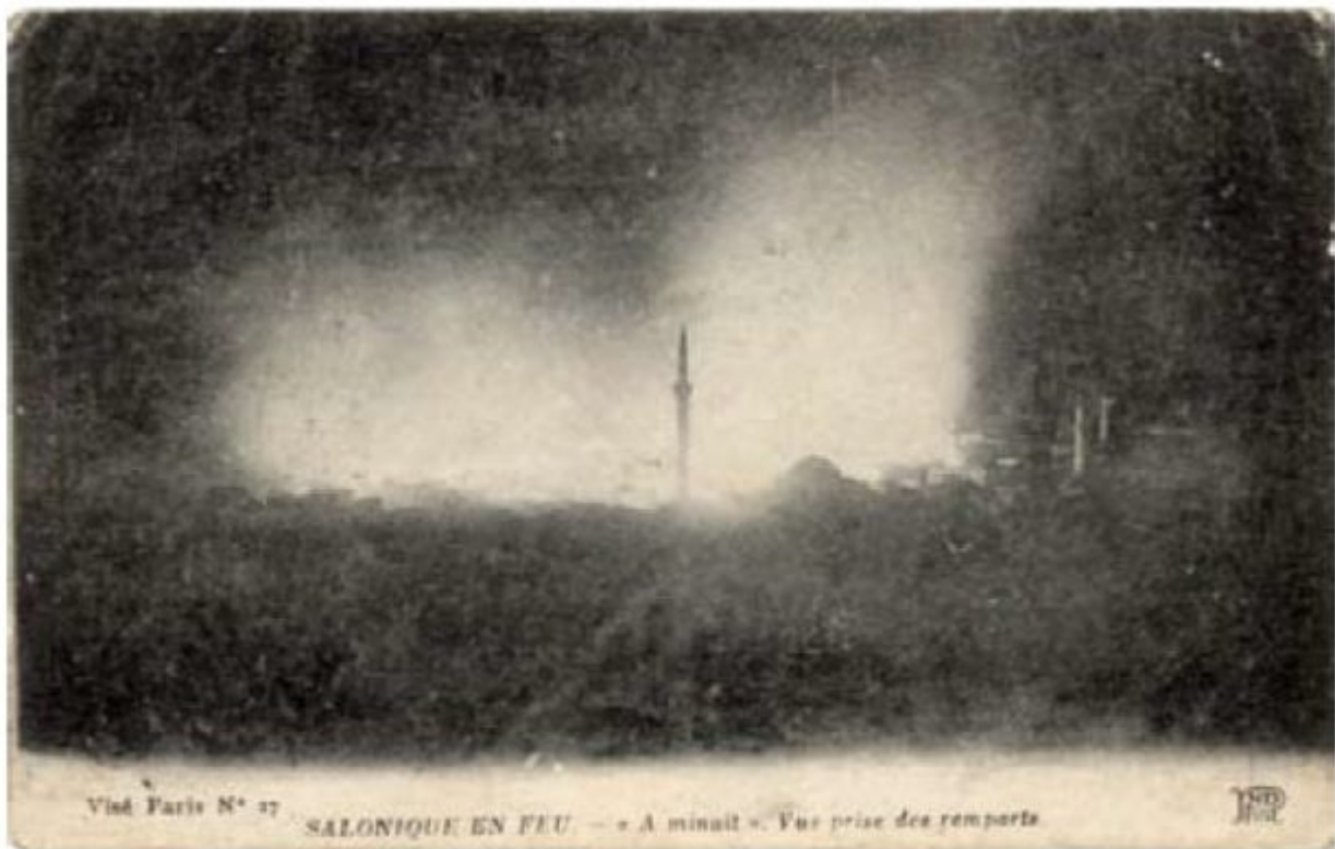
Η φλεγόμενη πόλη.

Ήταν μεσημέρι Σαββάτου 5 Αυγούστου 1917. Η μέρα ήταν ζεστή και ο βαρδάρης που φύσαγε σαν τρελός έσπρωχνε τις φλόγες προς την πόλη. Οι κατασκευές και οι ξυλοδεσιές ήταν ξερές από το καυτό και άνυδρο καλοκαίρι. Τα σπίτια καίγονταν το ένα μετά το άλλο με εκπληκτική ταχύτητα. Σε λίγη ώρα το κακό μαινόταν εκτός ελέγχου.