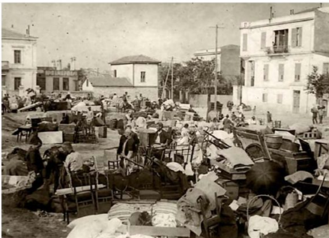
Πλήθος πυροπαθών ενώ η φωτιά μαινεται.