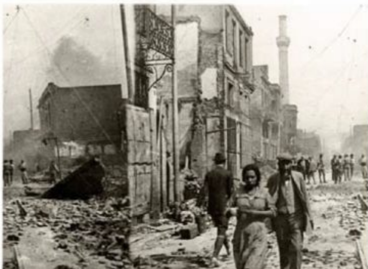
Εικόνες της καταστροφής

Ο ναός του αγίου Δημητρίου μετά την πυρκαγιά.