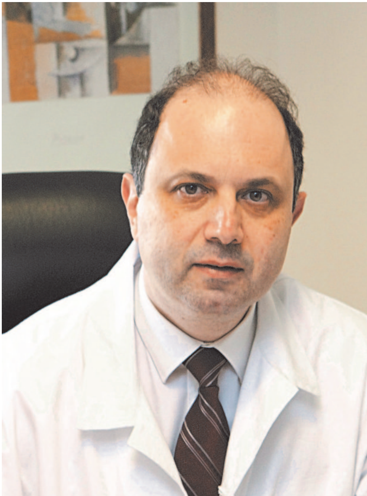
Ο κ. Κυριάκος Αναστασιάδης

Η ελληνική κλινική στην οποία γίνεται η πρωτοποριακή ερευνητική δουλειά είναι η Πανεπιστημιακή Καρδιοθωρακοχειρουργική Κλινική του Αριστοτελείου Πανεπιστημίου Θεσσαλονίκης (ΑΠΘ) στο νοσοκομείο ΑΧΕΠΑ. Όπως μας αναφέρει ο