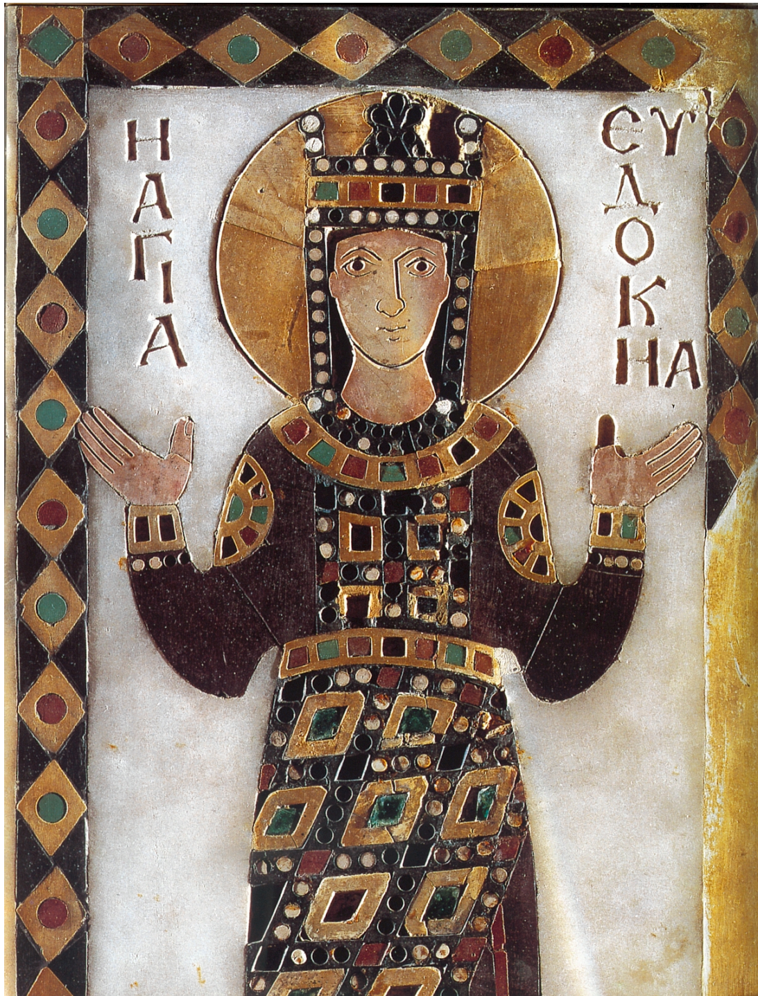
Η αγία αυτοκράτειρα Ευδοκία. Λεπτομέρεια εικόνας του 10ου αιώνα. Αρχαιολογικό Μουσείο Κωνσταντινούπολης.

Ήταν κόρη του αθηναίου φιλοσόφου Λεοντίου και γεννήθηκε το 401 μ.Χ. Σπούδασε κατά τον καλύτερο τρόπο τη γραμματική, τη ρητορική και τη φιλοσοφία. Όταν πέθανε ο Λεόντιος, άφησε όλη την περιουσία του στους γιους του, και σ' αυτή άφησε μόνο 100 χρυσά νομίσματα. Όταν, λοιπόν, ήλθε στην Κωνσταντινούπολη για να διεκδικήσει τα κληρονομικά της δικαιώματα, παντρεύτηκε τον Θεοδόσιο τον Β', μέσω της αδελφής του Πουλχερίας, που είχε κατενθουσιαστεί από τα σπάνια χαρίσματα της αθηναίας κόρης. Έτσι βαπτίστηκε χριστιανή και πήρε το όνομα