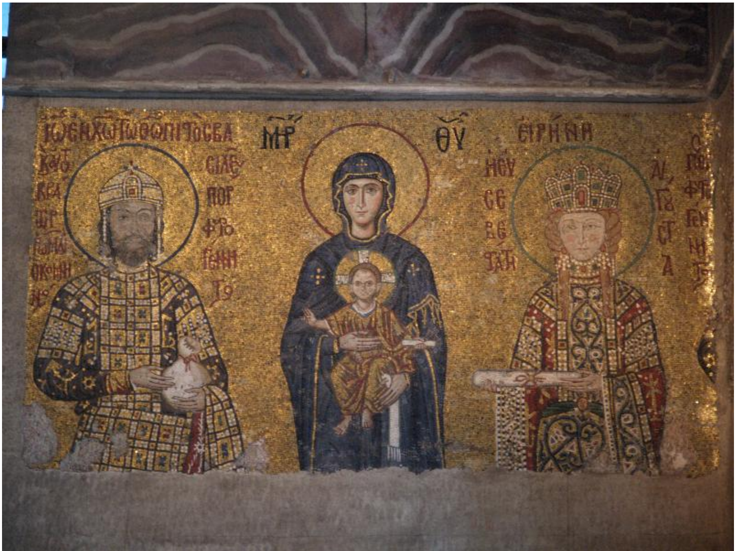
Η Παναγία με τον Χριστό ανάμεσα στον αυτοκράτορα Ιωάννη Β΄ και την σύζυγό του Ειρήνη. Ψηφιδωτό στην Αγία Σοφία της Κωνσταντινούπολης (1118).

Έζησε τον 12ο αιώνα μ.Χ. και ήταν κόρη ωραία και ενάρετη. Αυτό το παρατήρησε ο βασιλιάς Αλέξιος ο Κομνηνός και την πάντρεψε με το γιο του Ιωάννη, τον επονομαζόμενο Καλοϊωάννη λόγω των πολλών του αρετών. Η ενάρετη λοιπόν βασίλισσα Ειρήνη, ξόδευε με απλοχεριά σε φιλανθρωπικά έργα, μόνη μάλιστα