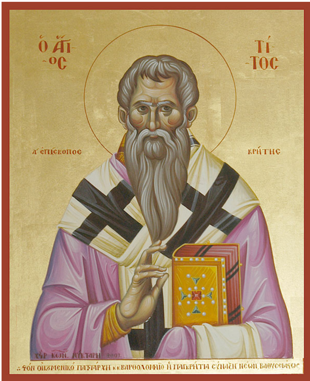
Άγιος Τίτος ο Απόστολος