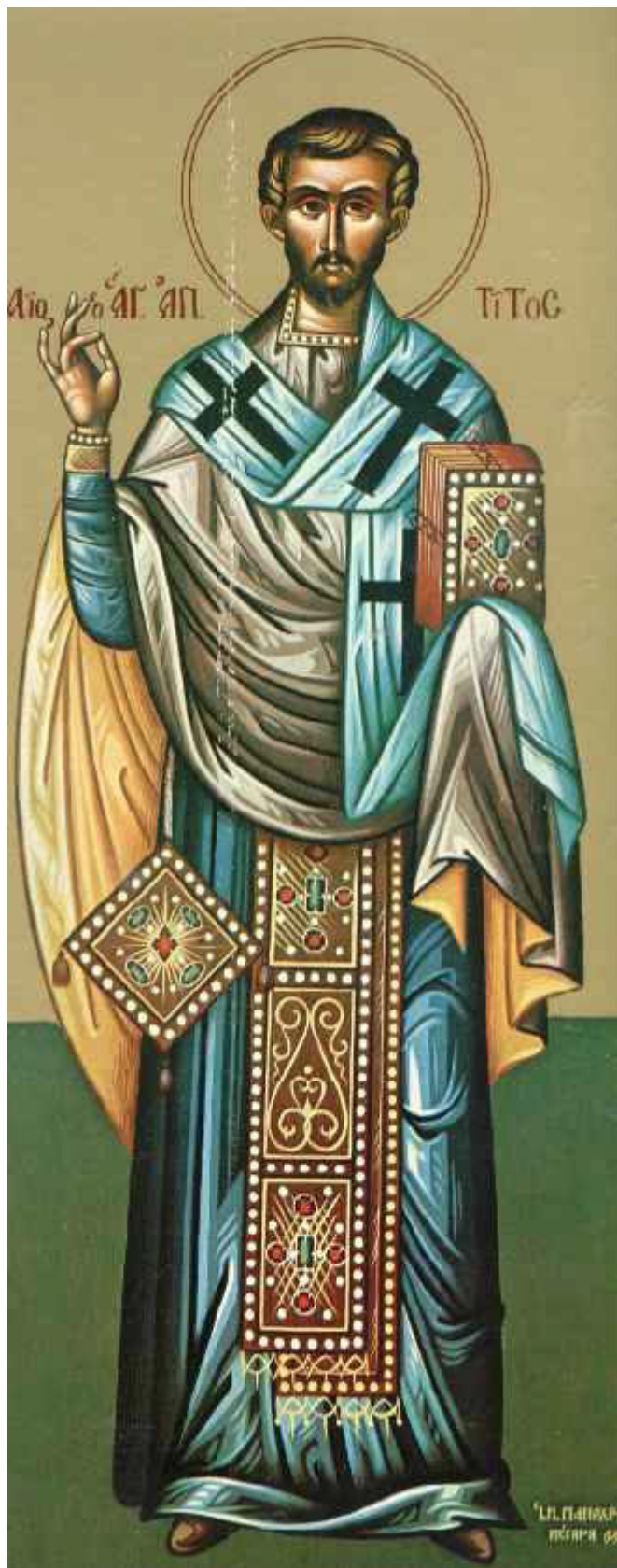
Άγιος Τίτος ο Απόστολος