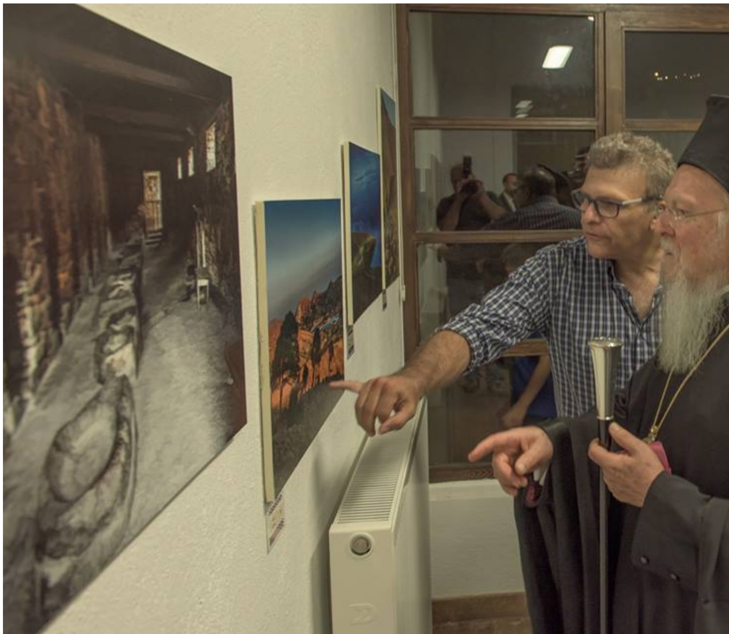
Ο Οικουμενικός Πατριάρχης ξεναγείται στην έκθεση από τον κ. Αραμπατζή