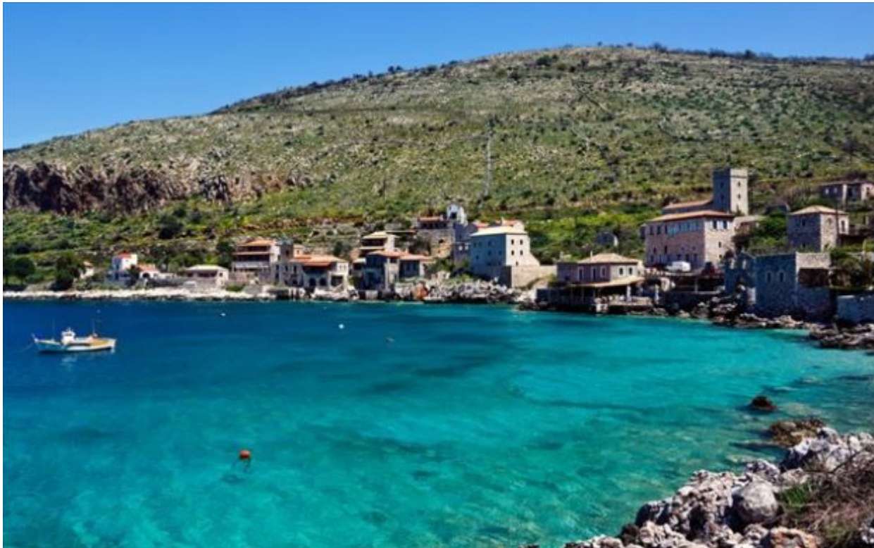
Λιμάνι, ένα όμορφο ψαροχώρι στη Μάνη

Σημαντικά μνημεία, μοναδικοί οικισμοί, γραφικές πόλεις και γοητευτικά κάστρα, αλλά και φυσικές ομορφιές, όπως βουνά και δάση, ποτάμια και σπήλαια, πανέμορφες παραλίες με βραχώδεις και δαντελωτές ακτές, κάνουν την Πελοπόννησο μια περιοχή που αποτελεί ιδανικό προορισμό όλες τις εποχές.