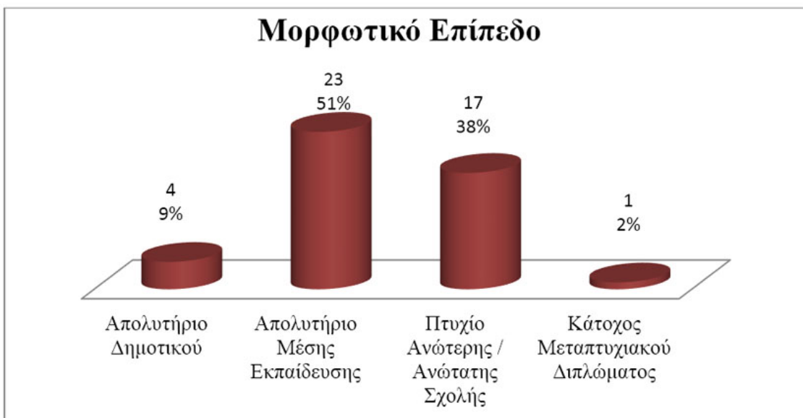
Διάγραμμα 5: Το Μορφωτικό Επίπεδο των συμμετεχόντων και ο αριθμός - τα ποσοστά τους ανά Μορφωτικό Επίπεδο/

Σχετικά με το μορφωτικό επίπεδο των ερωτηθέντων, τα 4 (9%) από τα 45 άτομα του δείγματος έχουν απολυτήριο Δημοτικού, τα 23 (51%) από τα 45 άτομα του δείγματος έχουν απολυτήριο Μέσης Εκπαίδευσης, τα 17 (38%) από τα 45 άτομα του δείγματος έχουν πτυχίο Ανώτερης / Ανώτατης Σχολής και το 1 (2%) από τα 45 άτομα του δείγματος είναι κάτοχος Μεταπτυχιακού / Διδακτορικού.