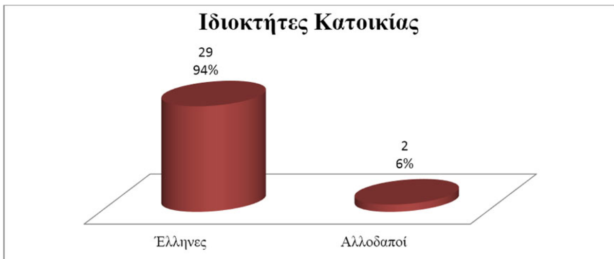
Διάγραμμα 7: Τα ποσοστά και οι αριθμοί των Περιουσιακών Στοιχείων ως προς την ιδιοκτησία κατοικίας των συμμετεχόντων στο Δήμο Αχαρνών με βάση την υπηκοότητα τους

Στην ερώτηση πώς χαρακτηρίζουν οι συμμετέχοντες την διαβίωση τους στο Δήμο Αχαρνών ως προς την ποιότητα ζωής, συνολικά τα 20 (45%) από τα 45 άτομα δήλωσαν Καθόλου Ικανοποιητική, τα 19 (42%) από τα 45 άτομα του δείγματος δήλωσαν Σχετικά Ικανοποιητική και τέλος τα 6 (13%) από τα 45 άτομα του δείγματος δήλωσαν Αρκετά Ικανοποιητική.