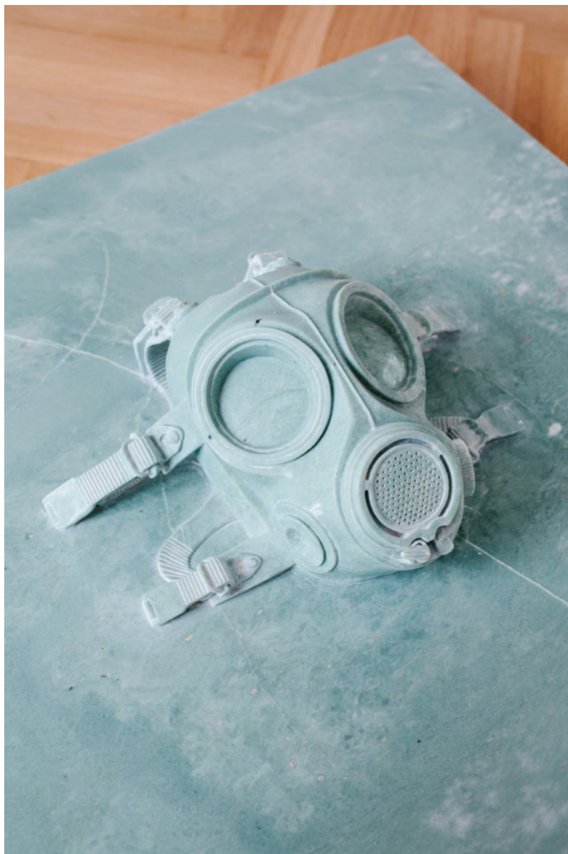
Mask, 2011 Marble, 80 x 80 x 30 cm

Υπενθυμίζεται ότι το Μουσείο Κυκλαδικής Τέχνης (το οποίο ιδρύθηκε το 1986 και «φιλοξενεί» περισσότερα από 3000 εκθέματα της κυκλαδικής, αρχαίας ελληνικής και κυπριακής τέχνης), έχει ως στόχο τη μελέτη και την προβολή των αρχαίων πολιτισμών του Αιγαίου και της Κύπρου, με ιδιαίτερη έμφαση στην κυκλαδική τέχνη της 3ης χιλιετίας π.Χ.