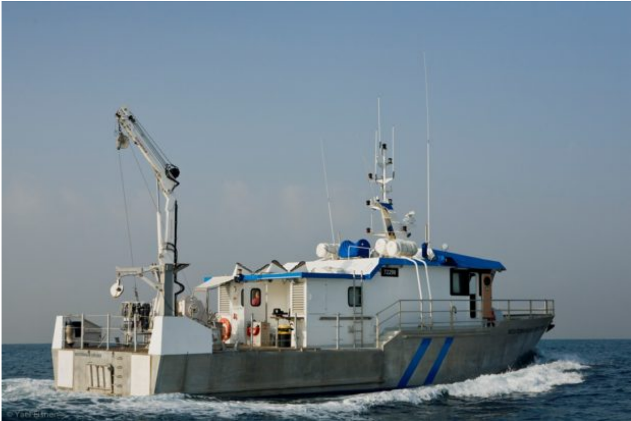
Το ισραηλινό ωκεανογραφικό σκάφος RV Mediterranean Explorer πραγματοποίησε δύο αποστολές στην περιοχή

Μελέτη στην επιθεώρηση «Nature Geoscience» εξετάζει τη Λεκάνη του Ηροδότου, μια βαθιά περιοχή της Μεσογείου ανάμεσα στην Κύπρο, την Κρήτη και την Αίγυπτο. Σε δύο αποστολές το 2012 και το 2014, το ισραηλινό ερευνητικό πλοίο RV Mediterranean Explorer πόντισε ένα ευαίσθητο μαγνητόμετρο και το έσυρε σε συνολική απόσταση 7.000 χιλιομέτρων, κινούμενο σε παράλληλες γραμμές.