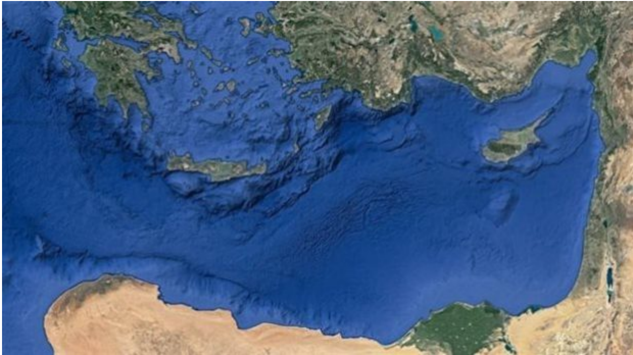
Η Μεσόγειος θεωρείται απομεινάρι του αρχαίου ωκεανού της Τηθύος

Έχει ηλικία 340 εκατομμυρίων ετών, και δεν αποκλείεται να είναι απομεινάρι από την εποχή της υπερηπείρου Γκοντβάννα