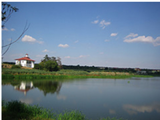
Η οικία του Αγίου Καλλινίκου στην Ιερά Μονή Τσερνίκα στη Ρουμανία

Το 1850 εξελέγη επίσκοπος Ρίμνικ κι εργάσθηκε πολύμοχθα και διαφορότροπα μ' επιτυχία για την πνευματική ανύψωση της επισκοπής. Στη σκήτη της επαρχίας του Φρασινεΐ εισήγαγε τους μοναχικούς θεσμούς του Αγίου Όρους. Το 1867 αποσύρθηκε στη μονή της μετανοίας του, για να ησυχάσει και να προσευχηθεί περισσότερο, προετοιμαζόμενος για την αναχώρησή του από τη γη. Ανεπαύθη οσιακά στις 11 Απριλίου του 1868, η οποία είναι και ημερομηνία της μνήμης του. Ετάφη στον ναό του Αγίου Γεωργίου, που είχε κτίσει ο ίδιος, με την παρουσία χιλιάδων πιστών. Ο άγιος ήταν κοσμημένος με τα χαρίσματα της προοράσεως και της θαυματουργίας. Πολλά θαύματα τελεί μέχρι σήμερα. Η επίσημη αναγνώριση της αγιότητάς του έγινε από την Εκκλησία της Ρουμανίας στις 21.10.1955. Εκλεκτός βιογράφος του είναι ο μαθητής του αρχιμανδρίτης Αναστάσιος Μπαλντοβίν. Η μνήμη του τιμάται στις 11 Απριλίου.