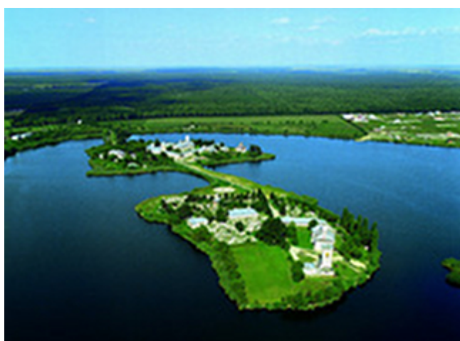
Πανοραμική άποψη Μονής Τσερνίκα στη Ρουμανία