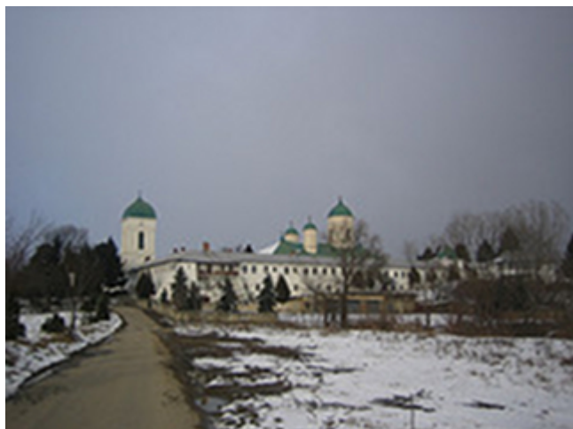
Η Μονή Τσερνίκα στη Ρουμανία

Γεννήθηκε στο Βουκουρέστι στις 7 Οκτωβρίου 1787. Στο άγιο βάπτισμα έλαβε το όνομα Κωνσταντίνος. Οι γονείς του ήταν ιδιαίτερα ευσεβείς. Η μητέρα του τελείωσε τον βίο της ως μοναχή. Μοναχός ήταν κι ένας μεγαλύτερος αδελφός του. Το 1807 εισήλθε στη μονή Τσερνίκα για να μονάσει. Το επόμενο έτος έλαβε το μοναχικό σχήμα και ονομάστηκε Καλλίνικος. Το ίδιο έτος χειροτονήθηκε διάκονος. Το 1813 χειροτονήθηκε πρεσβύτερος και το 1815 χειροθετήθηκε πνευματικός. Το 1817 μετέβη στο Άγιον Όρος με τον Γέρον-τά του Ποιμένα, ο οποίος έμεινε μόνιμα εκεί. Η παραμονή του στο Άγιον Όρος τον επηρέασε σημαντικά στην κατοπινή του πνευματική ζωή και στον προσωπικό, μυστικό, μεγάλο ασκητικό αγώνα. Το 1818 κατεστάθη ηγούμενος της Τσερνίκα και υπήρξε φωτεινό παράδειγμα για όλη τη φιλόθεη αδελφότητα, την οποία διαποίμανε θεάρεστα επί 32 ετη. Οι μοναχοί της μονής έφθασαν τους 350.