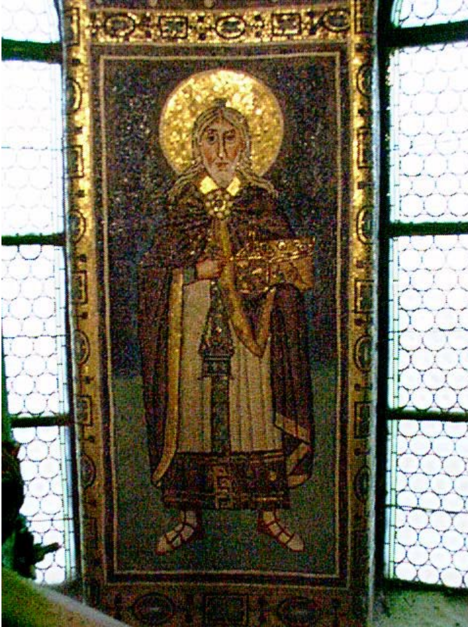
Ο προφήτης Ζαχαρίας. Ψηφιδωτό του βου αιώνα στην πανέμορφη βυζαντινή βασιλική του Ευφράσιου στο Porec της Κροατίας.

Ο προφήτης Ζαχαρίας κατήγετο από τον οίκο του αρχιερέως Αβιά, απογόνου του