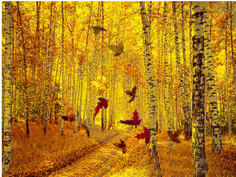
Αυτό, πραγματικά, το δέντρο μας

δε μου αρέσει καθόλου ούτε το φθινόπωρο ούτε και ο χειμώνας. Όλα είναι κρύα και παγωμένα. Το πράσινο χάνεται. Τα πουλιά ή φεύγουν ή σταματούν το κελάηδημα. Θα χάσεις όλα σου τα φύλλα! Πού