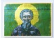
Ο συναξαριστής Άγιος από την Κωνσταντινούπολη

Η ΤΟΤΑ προβάλλει σε αξιολογικό κοίτασμα φυσικού αερίου με πιθανότητες πετρελαίου της τάξης του 50%. Η επιλογή για την πρώτη φάση, η οποία σύμφωνα με όλα τα στοιχεία θα γίνει μεταξύ Σεπτεμβρίου και Μαρτίου, είναι η καλύτερη επιλογή για την ανάπτυξη του κοιτάσματος.