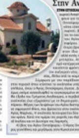
Στην Αναρίτα ασκήτευσε ο Άγιος

Στην νότια είσοδο του χωριού, βρίσκεται το εκκλησάκι του Αγίου Ονησίφορου. Παλαιότερα βρισκόταν στον ίδιο χώρο, αλλά εντός του κοιμητηρίου. Από σεισμό κατέρρευσε και η κοινότητα φρόντισε για την ανέγερση νέας εκκλησίας, δίπλα από το κοιμητήριο. Σύμφωνα με την παράδοση, εκεί στην περιοχή όπου κτίστηκε το εκκλησάκι υπάρχει το σπήλαιο, όπου ο Άγιος Ονησίφορος άγιασε. Δεν έχει όμως ακόμα ανακαλυφθεί το συγκεκριμένο σπήλαιο. Με έξοδο του Τμήματος Αναδασμού, ο περίβολος της εκκλησίας έχει εξωραϊστεί με τη δημιουργία μικρού πάρκου. Μέρους των λειψάνων του Αγίου διατηρούνται σε σφραγιστή θήκη, που βρίσκεται στην εκκλησία της Αγίας Μαρίας. Η εκκλησία λειτουργείται δύο φορές τον χρόνο. Κατά την ημέρα γιορτής του Αγίου στις 18 Ιουλίου και τη Δευτέρα της Λαμπρής.