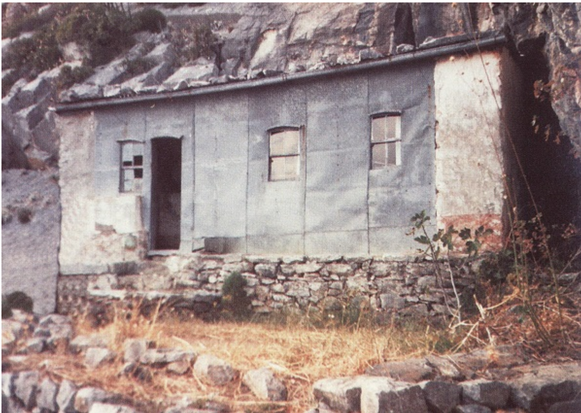
Ο Ιερός Ναός του Τιμίου Προδρόμου στην Σκήτη του Αγίου Βασιλείου.

Όσο για φαγητό; Καθημερινά μονοφαγία, το δε κυριότερο γεύμα παξιμάδι μάλιστα πολλές φορές μουχλιασμένο και σκουλικιασμένο. Το Σαββατοκυριακό, αν έβρισκαν, έτρωγαν και οτιδήποτε άλλο εκτός κρέατος, αλλά και πάλιν άπαξ (μονοφαγία).