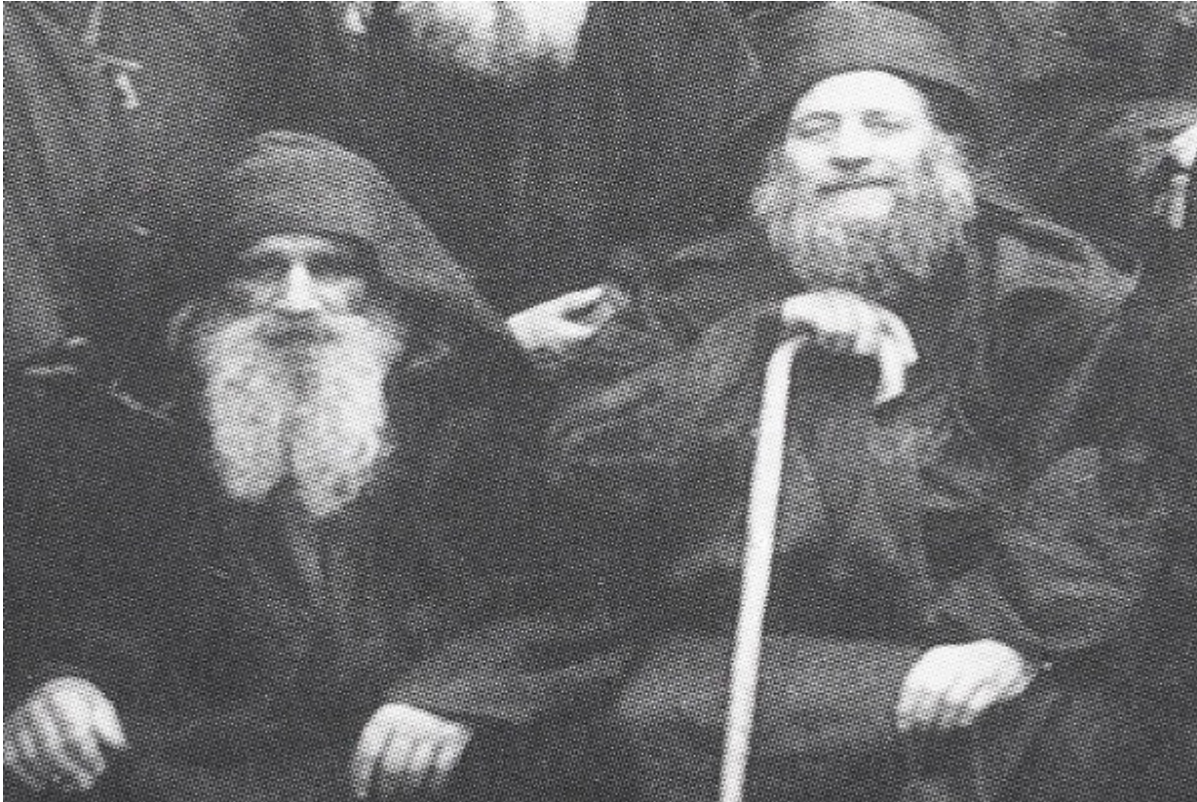
Οι μακάριοι Γέροντες Αρσένιος (αριστερά) και Ιωσήφ (δεξιά) οι Σπηλαιώτες και Ησυχαστές, οι για σαράντα χρόνια αχώριστοι συνασκητές. Λεπτομέρεια μεγαλύτερης φωτογραφίας.

Ο άλλος νέος ήταν ο μεγάλος μετέπειτα νηπτικός ασκητής του 20ου αιώνας Ιωσήφ ο Ησυχαστής, ο οποίος τότε με το λαϊκό του όνομα λεγόταν Φραγκίσκος Κώττης.