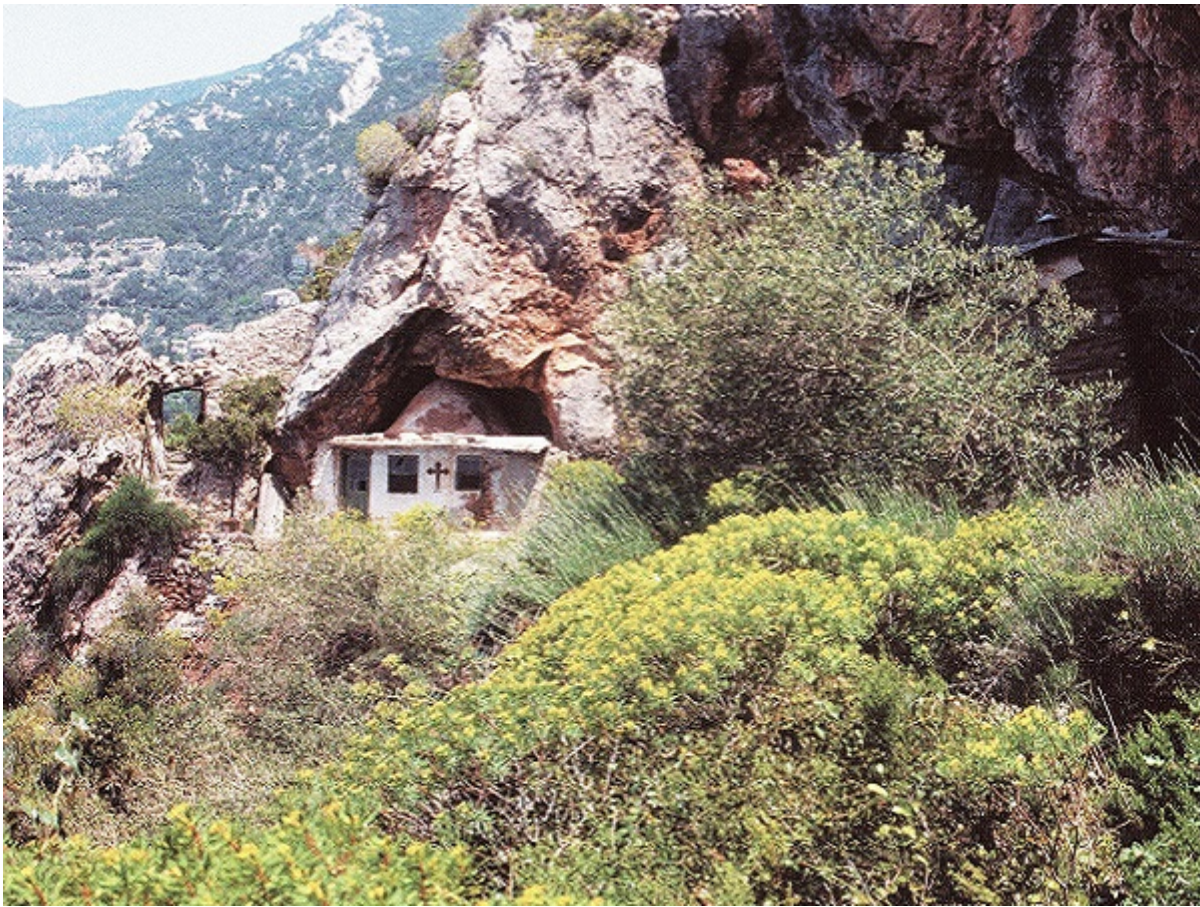
Ο Ιερός Ναός του Τιμίου Προδρόμου στις σπηλιές της Μικράς Αγίας Άννας.

Γι' αυτούς άρμοζε ο λόγος του αποστόλου: «περιήλθον εν μηλωταίς εν αιγείις δέρμασιν, υστερούμενοι, κακουχούμενοι, ων ουκ ην άξιος ο κόσμος· εν ερημίαις πλανώμενοι και όρεσι και σπηλαιίσι και ταις οπαίς της γής (Εβρ. ια' 37-38).