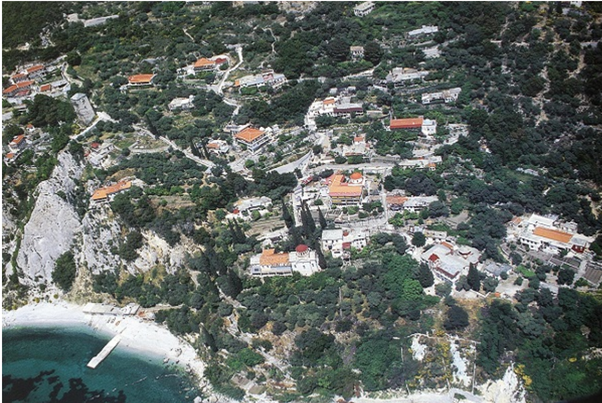
Πανοραμική άποψη της Νέας Σκήτης, η οποία διοικητικά υπάγεται στην Ιερά Μονή Αγίου Παύλου.

Με τον Γέροντα Αρσένιον έζησα δεκαοκτώ συναπτά έτη. Εγνώρισα την αρετή του· τους πλούσιους καρπούς του Αγίου Πνεύματος, αγάπη, χαρά, ειρήνη κ.λ.π., αλλά προ πάντων την μακαρίαν απλότητα και ακακία, την ευθύτητα, την ειλικρίνεια και τη μεγάλη ταπείνωση, το μεγάλο αγωνιστικό φρόνημα κ.ά.