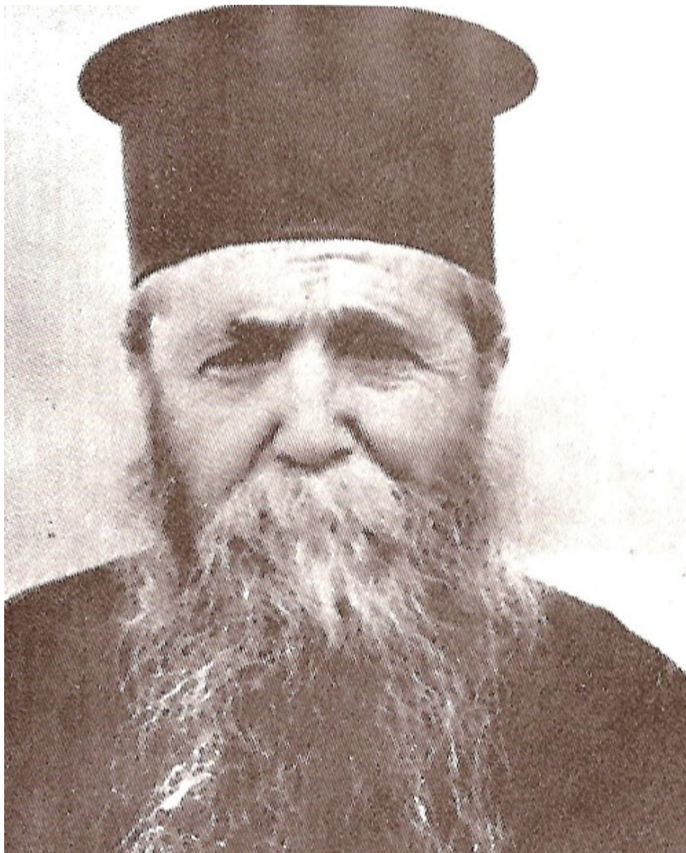
Ο μακαριστός Γέροντας Ιερώνυμος της Αίγινας, ο οποίος υπήρξε ο πρώτος εν Χριστώ διδάσκαλος του μακαρίου Γέροντα Αρσένιου του Σπηλαιώτου και Ησυχαστού.

Αλλά η διψασμένη εκείνη ψυχή, πυρομένη από τον ένθεον έρωτα λέγοντας μετά του Δαυΐδ: «εδίψησέ σε η ψυχή μου εν γη ερήμω και αβάτω και ανύδρω», άφησε τους θορύβους του κόσμου και μετέβη στον Άθωνα, στο Αγιώνυμο περιβόλι της Θεοτόκου.