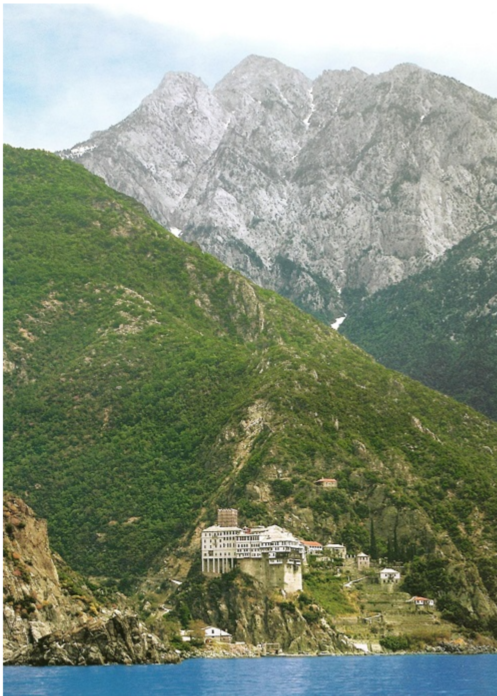
Η Ιερά Μονή Αγίου Διονυσίου, Αγίου Όρους.

Σ' όλα του τα χρόνια ο Γέρων Αρσένιος είχε προστάτην τον Μέγαν Πρόδρομον. Εκεί λοιπόν στη Μονή πλήρης ημερών με οσιακό τέλος αφήκε την τελευταία του αναπνοή στις 2/15 Σεπτεμβρίου του 1983 στα χέρια του Βαπτιστού Ιωάννου. Αιωνία αυτού η μνήμη.