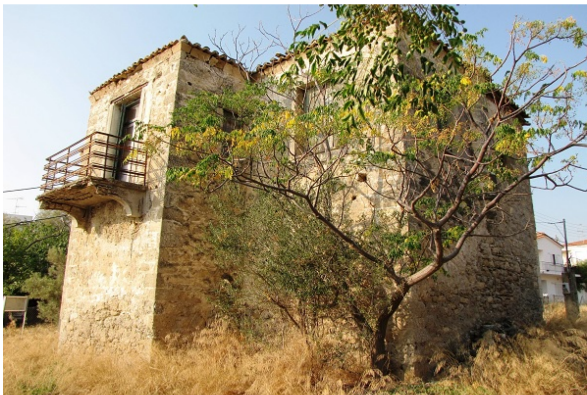
Εικόνα 13: Άποψη του πυργόσπιτου του Κιαμήλ Μπέη από τα δυτικά. Εκτιμάται ότι είναι