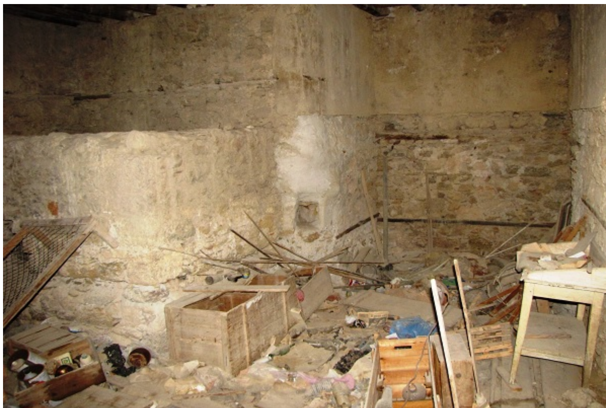
Εικόνα 12: Άποψη του εσωτερικού από τον βορειοδυτικό θάλαμο του ισογείου ορόφου. Στο αριστερό διακρίνεται η τετράγωνη κατασκευή, που πιθανότατα χρησίμευε ως δεξαμενή ύδατος του πυργόσπιτου.

καλύπτεται με τετράριχτη στέγη και ο στενότερος πυργοειδής προμαχώνας με τρίριχτη, ενώ τα πατώματα και η οροφή είναι ξύλινα. Κατά πάσα πιθανότητα, η είσοδος στο εσωτερικό του αυθεντικού κτιρίου γίνονταν από τον βασικό χώρο διαμονής στο ύψος του δεύτερου ορόφου της νοτιοδυτικής πλευράς, μέσω μίας αποσπώμενης γέφυρας από σανίδες που στερεώνονταν σε ένα ανεξάρτητο κλιμακοστάσιο, κτισμένο περίπου 1,50 μέτρο απέναντι από την πρόσοψη, σε αντιστοιχία με τα πρότυπα άλλων παρόμοιων πυργόσπιτων της Οθωμανικής περιόδου. Κατά τις νυκτερινές ώρες, οι ένοικοι αναδίπλωναν ή απέσυραν την σανιδένια γέφυρα, απομονώνοντας την κατοικία για να προφυλαχθούν από τυχόν απρόσμενες επιδρομές ληστών και πειρατών(10). Σήμερα η πρόσβαση στον δεύτερο όροφο γίνεται από ένα κατοπινό τσιμεντένιο κλιμακοστάσιο και το ισόγειο διαθέτει την δική του είσοδο.