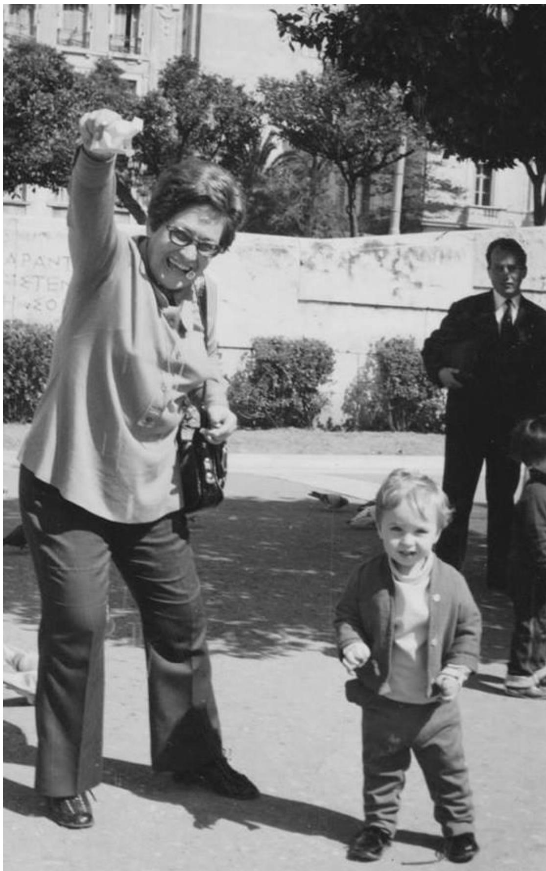
Από Γιάννης Σουρέλης

Έφυγε όπως της άξιζε. Με μια τελευταία πνοή μέσα στη γαλήνη και την ησυχία του σπιτιού της. Χωρίς νοσοκομεία και εντατικές, χωρίς πόνο και ταλαιπωρία. Της