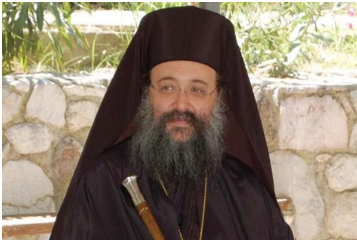
Ο Σεβ. Μητροπολίτης Πατρών κ. Χρυσόστομος

Σήμερα, η ενορία μας χαίρει και σεμνύνεται για τον όμορφο Ιερό Ναό μας! Στον ίδιο αρχιτεκτονικό ρυθμό με τον πρωταρχικό, με όμοια εσωτερική διαρρύθμιση, αλλά και με νέες προσθήκες, έντονη φωτεινότητα, κάθε ομορφιά που οι πιστοί με τις δωρεές τους συνεισέφεραν! Η καθαρότητα τού χώρου, είναι ίσως το πρώτο πράγμα που καθένας όταν εισέρχεται στον Ναό, προσέχει! Σε συνδυασμό μάλιστα με το όντως φροντισμένο, απλό και συνάμα όμορφα διακοσμημένο εσωτερικό, η Αγία Τριάδα θυμίζει παραδείσιο τοπίο!