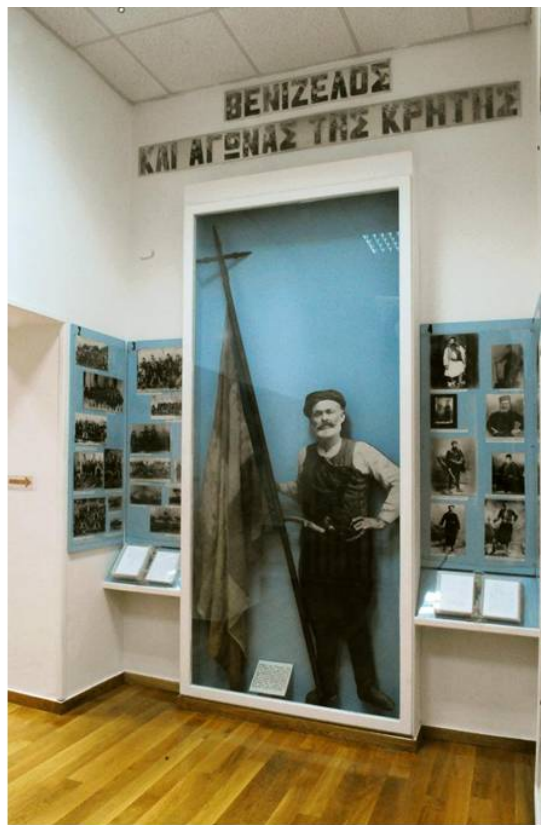
OPANDA, MUSEUM "ELEFTHERIOS K. VENIZELOS" 2015

Μεταξύ των εκθεμάτων του Μουσείου η Σημαία του Κρητικού αγώνα του 1897