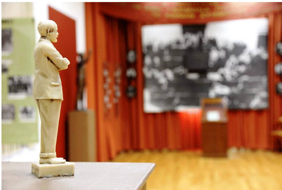
ΟΠΑΝΔΑ, ΜUSEUM "ΕΛΕΦΘΗΡΙΟΣ Κ. ΒΕΝΙΖΕΛΟΣ"