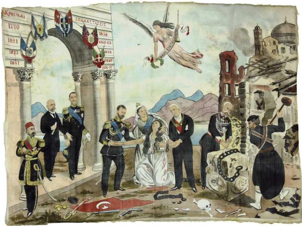
OPANDA, MUSEUM "ELEFTHERIOS K. VENIZELOS"