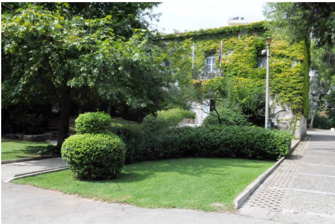
OPANDA, MUSEUM "ELEFTHERIOS K. VENIZELOS" 2015

Με αφορμή τη συμπλήρωση 30 ετών λειτουργίας του Μουσείου «Ελευθέριος Κ. Βενιζέλος», 80 ετών από το θάνατο του Ελευθερίου Βενιζέλου και 25 ετών από το θάνατο του δωρητή του Μουσείου, Δημοσιογράφου Αντώνη Μακατούνη, ο Οργανισμός Πολιτισμού, Αθλητισμού, Νεολαίας του Δήμου Αθηναίων και η οικογένεια του δωρητή Αντώνη Μακατούνη, διοργανώνουν επετειακή εκδήλωση, την Πέμπτη 6 Οκτωβρίου, στις 19.00μ.μ., στο Μουσείο «Ελευθέριος Κ. Βενιζέλος», που βρίσκεται στο Πάρκο Ελευθερίας.