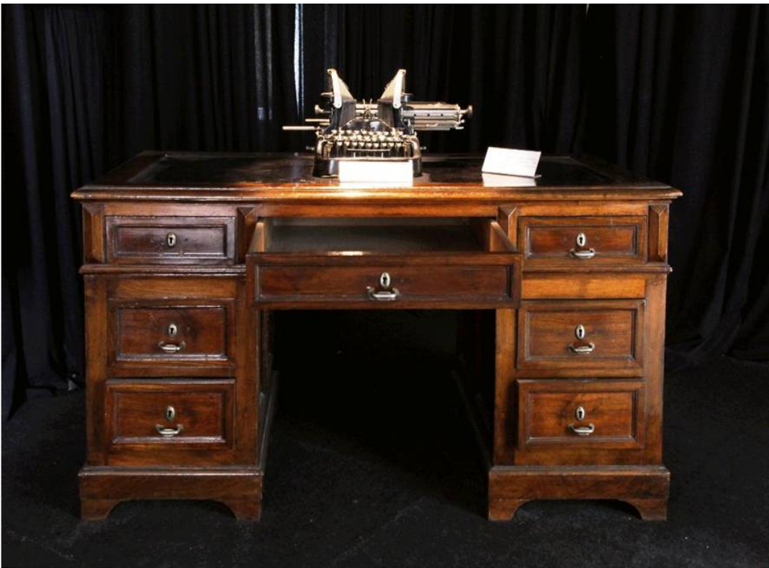
OPANDA, MUSEUM "ELEFTHERIOS K. VENIZELOS"

Ο παππούς όμως ήθελε το σπάνιο υλικό να εκτίθεται σε έναν ακόμα καλύτερο χώρο, με το «όνειρό» του να παίρνει «σάρκα» και «οστά» εν έτει 1986, όπου ξεκίνησε τη λειτουργία του για πρώτη φορά στο νέο (τότε) χώρο, σε έναν ιστορικό και καλαίσθητο χώρο στο «Πάρκο Ελευθερίας», απέναντι από τον ανδριάντα του Εθνάρχη, στεγαζόμενο σε ένα όμορφο νεοκλασικό κτήριο που ανήκε στο δήμο Αθηναίων. Ο χώρος όπου στεγάζεται σήμερα το Μουσείο, έχει μακρά κι ενδιαφέρουσα ιστορία. Επί εποχής Βενιζέλου, το Πάρκο Ελευθερίας χρησιμοποιήθηκε ως Επιτελείο του 34ου Συντάγματος. Μάλιστα, στο κεφαλόσκαλο του κτηρίου - το οποίο φιλοξενεί σήμερα το Μουσείο - ο Βενιζέλος αποχαιρέτησε τους αξιωματικούς και τους στρατιώτες που έφευγαν για το μέτωπο, κατά τους Βαλκανικούς Πολέμους.