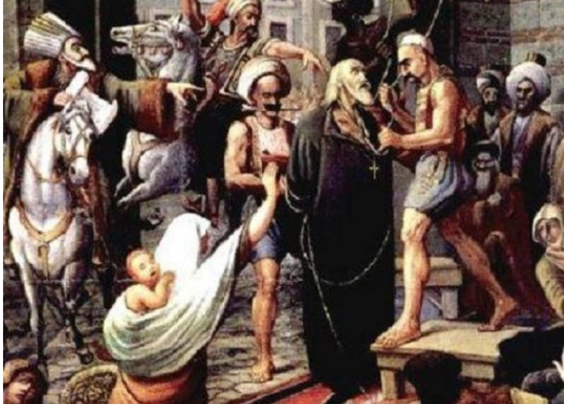
Η Ιερά Εικόνα

του Μεγάλου αυτού Ρωμιού, θα παραμείνει δια παντός στην Ιερά Μονή προς αγιασμόν των ενθάδε ασκούμενων Πατέρων. Εμείς με τις ευλογίες της Μητέρας Εκκλησίας θα τοποθετούμε εικόνες του Εθνομάρτυρα Ιεράρχη Γρηγορίου, εις πείσμα ορισμένων που ενοχλούνται, όπως όταν τοποθετήθηκε η εικόνα του στην κλειστή Πύλη το 1907 επί σουλτάνου Αβδούλ Χαμίτ, ο οποίος απαίτησε εκνευρισμένος να την κατεβάσουν.