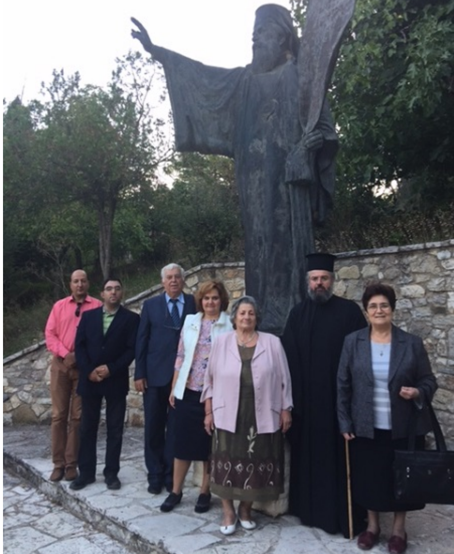
Ο Γρηγόριος ο Ε΄, ο

φλογερός αυτός Ιεράρχης, ακολούθησε τον δρόμο του μαρτυρίου του Μεγάλου Αρχιερέα Χριστού. Σάρκωσε ολόκληρο το υπόδουλο Γένος. Επωμίσθηκε το σταυρό του, ανέβηκε το Γολγοθά του. Δέχθηκε ραπίσματα, χλευασμούς, εμπτυσμούς και τέλος τον θάνατο με απαγχονισμό από Οθωμανούς και Ιουδαίους στην πύλη του Πατριαρχείου, την 10η Απριλίου του 1821 ανήμερα του Πάσχα. Είκοσι ημέρες μετά την έκρηξη της Επανάστασης εδώ στο Μέγα Μοναστήρι, από τον ανιψιό του Δεσπότη Παλαιών Πατρών Γερμανού. Αδιάψευστα στοιχεία για την αποφασιστική συμμετοχή της Εκκλησίας και των δύο προαναφερθέντων στην έναρξη του αγώνα εδώ στην Αγία Λαύρα.