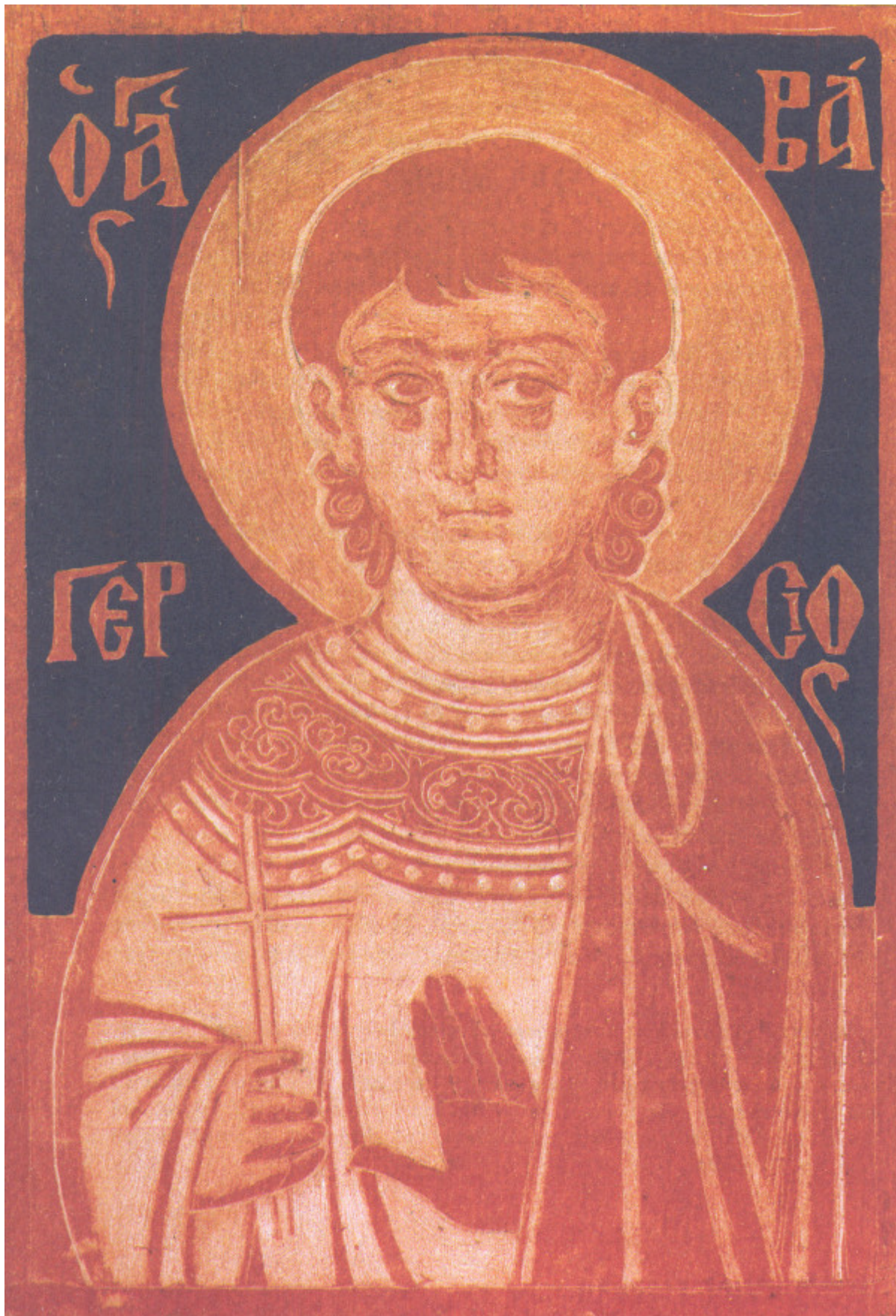
Ο άγιος Ναζάριος έζησε στά χρόνια του Νέρωνος (μεταξύ 54 και 68)1 στή Ρώμη.