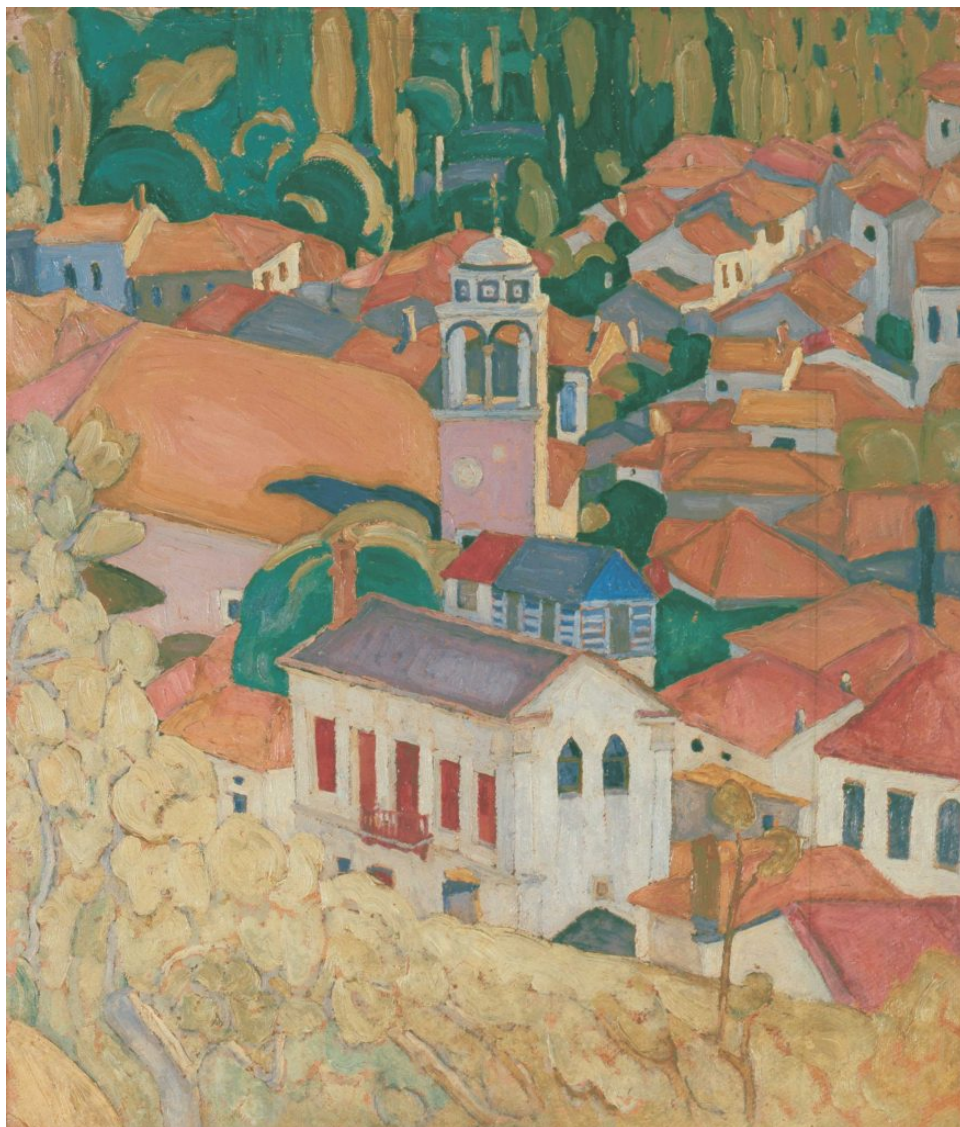
Σ.Παπαλουκάς, Καμπαναριό και κόκκινες στέγες, 1925, λάδι σε χαρτόνι, 59x48εκ4

Ακούραστα, όλα τα δημιουργικά του χρόνια επιδίωκε τη μελετημένη οργάνωση του ζωγραφικού χώρου, βασισμένου στις αρμονικές χαράξεις, τη στέρεα δομή της σύνθεσης, την αρμονία των χρωμάτων και των τόνων. Η ένταση της εικόνας ήταν το ζητούμενο, όπως, για παράδειγμα, ένα τοπίο από τη Μυτιλήνη ή την Πάρο, καμωμένο στην ύπαιθρο με χρώμα και φως, που σου προκαλεί την εντύπωση της ζωντάνιας και της αλήθειας της φύσης. Ο Παπαλουκάς επέστρεφε πάντα στη φύση, ως το τέλος της ζωής του, προσφέροντας ένα έργο πλούσιο σε έμπνευση και παλμό, που ανακαλύπτει και αναδεικνύει τον ποιητικό παράδεισο της Ελλάδας».