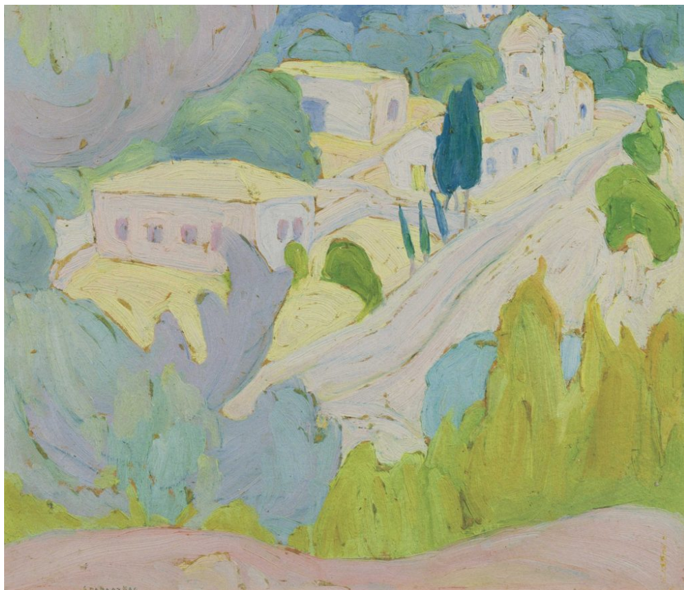
Σ.Παπαλουκάς, Άποψη Αίγινας, 1923, λάδι σε χαρτόνι, 20×24εκ

οι μακέτες της Μητροπόλεως Αμφίσσης (1927), οι φορητές εικόνες «Η Προδοσία», «Η Αποκαθήλωση», «Ο Άγιος Ανεμπόδιστος», «Ο Εσταυρωμένος Χριστός», «Ο Άγιος Δημήτριος» και τα υπέροχα ανθίβολα, μαρτυρούν τη βαθιά του αφοσίωση στη χριστιανική παράδοση.