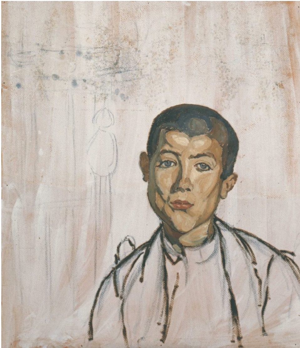
Σ.Παπαλουκάς, Πορτρέτο παιδιού,1925,λάδι σε χαρτόνι, 59,5×51εκ

αναλλοίωτη διατηρώντας τη λάμψη της σ' όλους τους καιρούς... Δεν προτείνει τρόπο ζωγραφικής, αλλά την έρευνα σε βάθος. Είναι το στοιχείο, νομίζω, που τον κάνει κάθε στιγμή επίκαιρο».