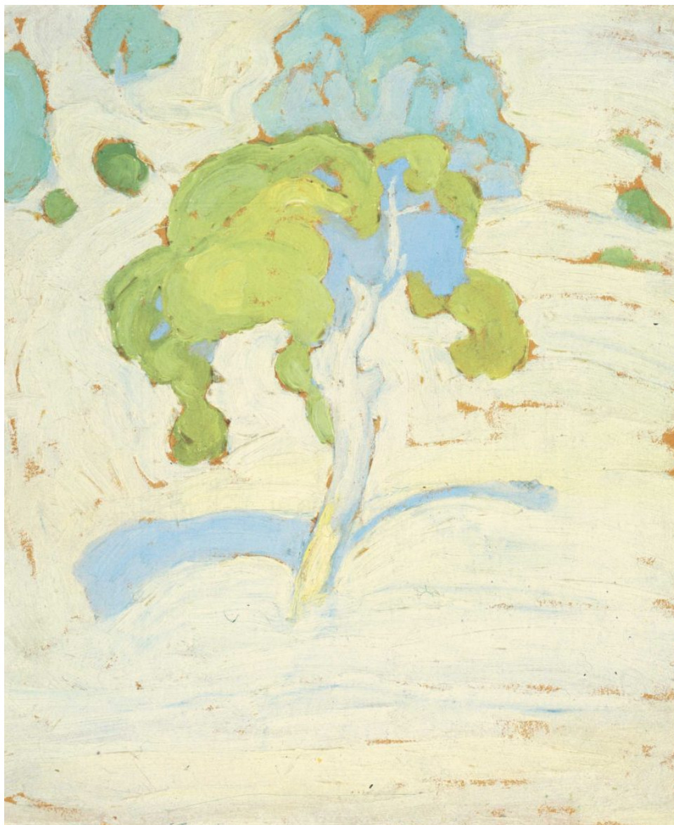
Σ. Παπαλουκάς, Δέντρο, 1923, λάδι σε χαρτόνι, 24x20εκ

Η έκθεση «Σπύρος Παπαλουκάς. Synopsis. Ζωγραφική, αγιογραφίες, σχέδια και μακέτες» είναι η 6η ατομική έκθεση που έχει οργανώσει το Ίδρυμα Εικαστικών Τεχνών και Μουσικής Β. και Μ. Θεοχαράκη από την ίδρυσή του το 2007. Την επιμέλειά της έχει ο Τάκης Μαυρωτάς, ενώ η έκθεση η οποία ξεκίνησε την Τετάρτη 5 Οκτωβρίου, θα διαρκέσει έως τις 30 Οκτωβρίου.