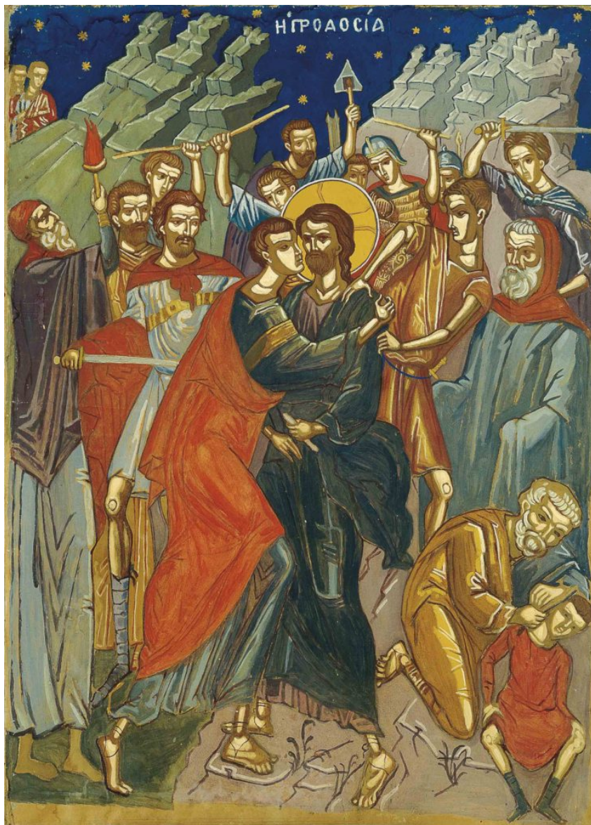
Σ. Παπαλουκάς, Η προδοσία, τέμπρα, 128,5×92,5, αντίγραφο από τη μακέτα της Μητροπόλεως Αμφισσας

Ο Γιάννης Μόραλης γράφει για το έργο του Παπαλουκά: «Πάντα θαύμαζα στα έργα του τη σοφή σύνθεση, το ευαίσθητο χρώμα και την αγάπη με την οποία ήταν καμωμένα. Λυπάμαι, που δεν είχα την τύχη να τον γνωρίσω περισσότερο και σαν άνθρωπο, γιατί ο Σπύρος Παπαλουκάς, εκτός από την προσφορά του στην ελληνική τέχνη, έδωσε το μεγάλο παράδειγμα ενός τίμιου και αφοσιωμένου στην εργασία του ζωγράφου, που δεν θέλησε ποτέ να προδώσει τον εαυτό του, για μια εύκολη επιτυχία», ενώ ο Δημήτρης Μυταράς από τη δική του πλευρά υποστηρίζει: «Νομίζω ότι από τους ζωγράφους της γενιάς του, είναι ο πλέον «διδασκτικός», με την έννοια του δασκάλου που στο έργο του κωδικοποιούνται μια σειρά από συμπεράσματα.