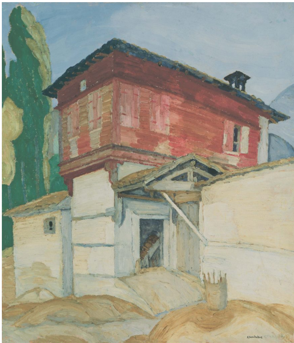
Σ.Παπαλουκάς,Κόκκινος πύργος, 1925,λάδι σε χαρτόνι, 57×50εκ

Το σχέδιο αποτελεί τον πυρήνα της ζωγραφικής του δράσης, ορίζοντας την αρχή των πάντων. Σχεδιάζει συνήθως με το αιχμηρό μολύβι, για μεγαλύτερη ακρίβεια, αφήνοντας σε αρκετούς πίνακες κυρίαρχη την αίσθηση του σχεδίου, χωρίς να το καλύπτει με χρώματα. Παράλληλα, όταν ήθελε να τονίσει τα περιγράμματα, σε ορισμένες του συνθέσεις, άφηνε ένα κενό στην επιφάνεια του πίνακα αχρωμάτιστο. (...)