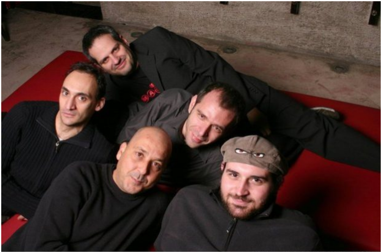
HeavyDugProjectPNC_1534_in.jpg - COPRISDIT2005 By Maxime Gyselsink - Athens