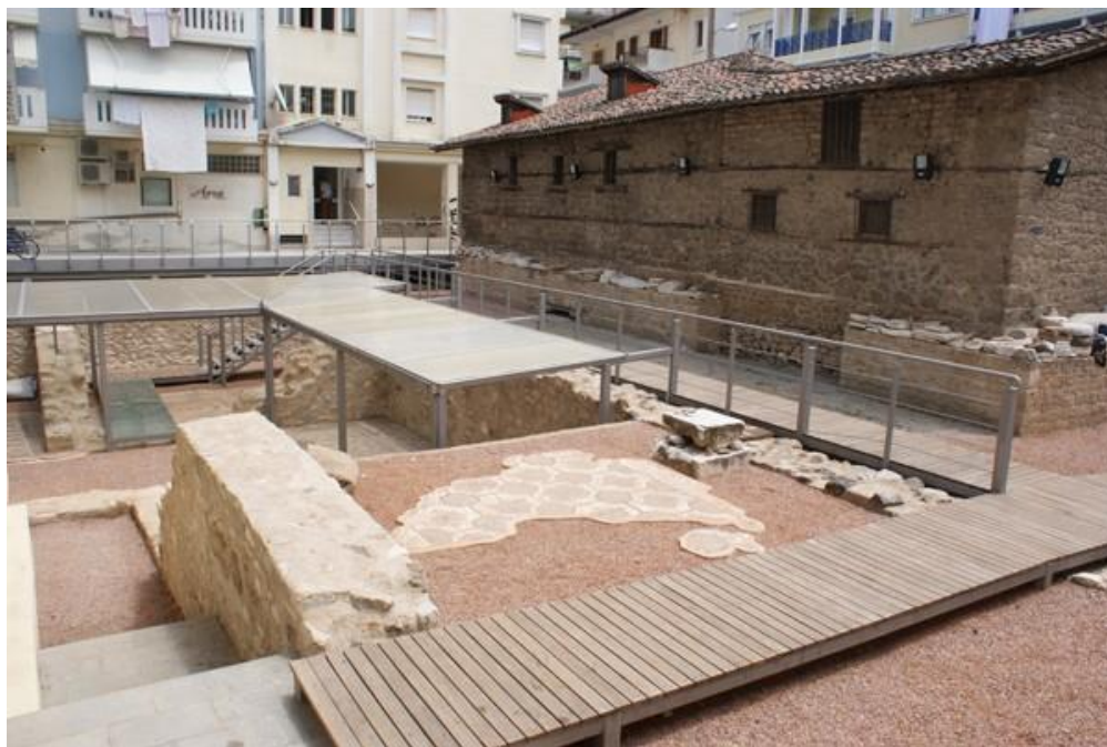
http://odysseus.culture.gr/h/3/gh3560.jsp?obj_id=5108 , Αρχαιολογικός χώρος Αγίου Παταπίου Βεροίας

Ο Ναός αρχικά είχε τη μορφή τρίκλιτης ξυλόστεγης βασιλικής. Στις αρχές του 16ου αιώνα ανακατασκευάστηκε, διατηρώντας μόνο το ιερό το οποίο ενσωματώθηκε ως διακονικό, στον νεότερο και μεγαλύτερο ναό. Σήμερα υπάρχουν τοιχογραφίες που χρονολογούνται από τον αρχικό ναό τον 15ο αιώνα έως τον 18ο αιώνα. Στον περιβάλλοντα χώρο του ναού, διακρίνονται τα υπολείμματα συγκροτήματος παλαιοχριστιανικού βαπτιστηρίου (δεύτερο μισό του 4ου αι.) και τρίκλιτης βασιλικής με εγκάρσιο κλίτος (5ος αι.).