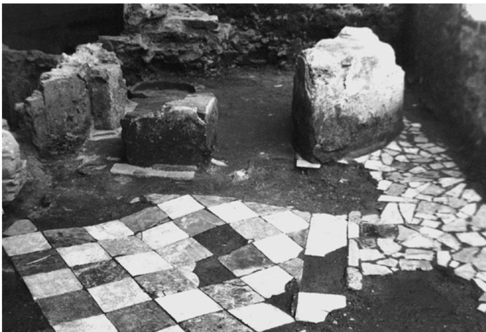
Αρχαιολογικός χώρος Αγίου Παταπίου Βεροίας, http://odysseus.culture.gr/h/3/gh3560.jsp?obj_id=5108

Η Εφορεία Αρχαιοτήτων Ημαθίας, συμμετέχοντας και φέτος στη δράση «Περιβάλλον και Πολιτισμός», του υπουργείου Πολιτισμού, που έχει ως στόχο να αναδείξει το φυσικό και πολιτιστικό πλούτο της χώρας και να ευαισθητοποιήσει τους πολίτες για την προστασία του, παρουσιάζει από τις 20 ως τις 24 Οκτωβρίου, πέντε «Λαμπερές ιστορίες φωτιάς», σε αρχαιολογικούς χώρους και μουσεία της Ημαθίας, για σχολικές ομάδες, ανεξάρτητους επισκέπτες, παιδιά και ενήλικες.