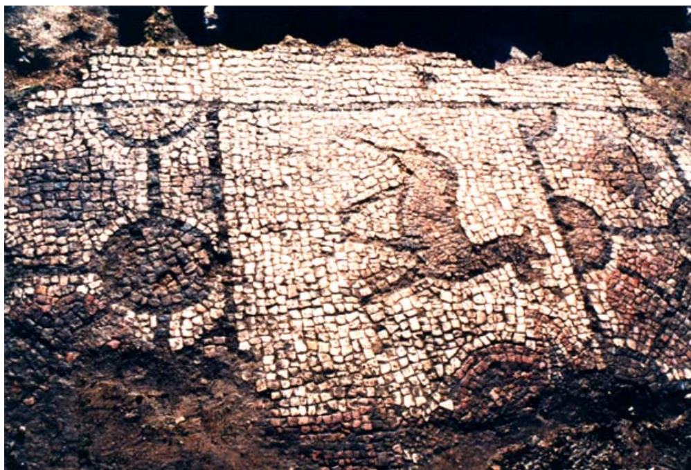
http://odysseus.culture.gr/h/3/gh3560.jsp?obj_id=5108 , Αρχαιολογικός χώρος Αγίου Παταπίου Βεροίας

Για τα σχολικά τμήματα της Γ' και Δ' Δημοτικού στη Βέροια, θα υπάρχει η δυνατότητα στην συμμετοχής στο εκπαιδευτικό πρόγραμμα «Ανιχνεύοντας τις φλόγες στον Άγιο Πατάπιο», το οποίο θα γίνει στις 20 και 21 Οκτωβρίου. Τα παιδιά μέσα από εκπαιδευτικά προγράμματα, θα εξερευνήσουν τη χρήση της φλόγας, θα μιλήσουν για τους συμβολισμούς που εμπεριέχει όταν απεικονίζεται σε τοιχογραφίες, θα μιλήσουν όμως και για τη φλόγα της πίστης, τη φλόγα του κεριού, αλλά και για την πυρκαγιά και τις φθορές που προκάλεσε στο ναό.