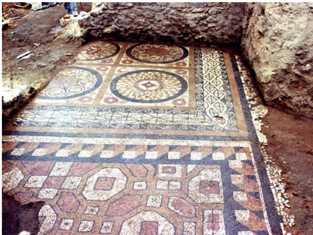
http://odysseus.culture.gr/h/3/gh3560.jsp?obj_id=5108 , Αρχαιολογικός χώρος Αγίου Παταπίου Βεροίας

Η περίοδος εγκατάλειψης του χώρου σύμφωνα με τα ανασκαφικά δεδομένα, θα πρέπει να τοποθετηθεί σε χρόνους όχι πρωιμότερους των αρχών του 7ου αι., περίοδος κατά την οποία δημιουργήθηκε ένα εκτεταμένο νεκροταφείο, στα ερείπια του κτιρίου του συγκροτήματος.