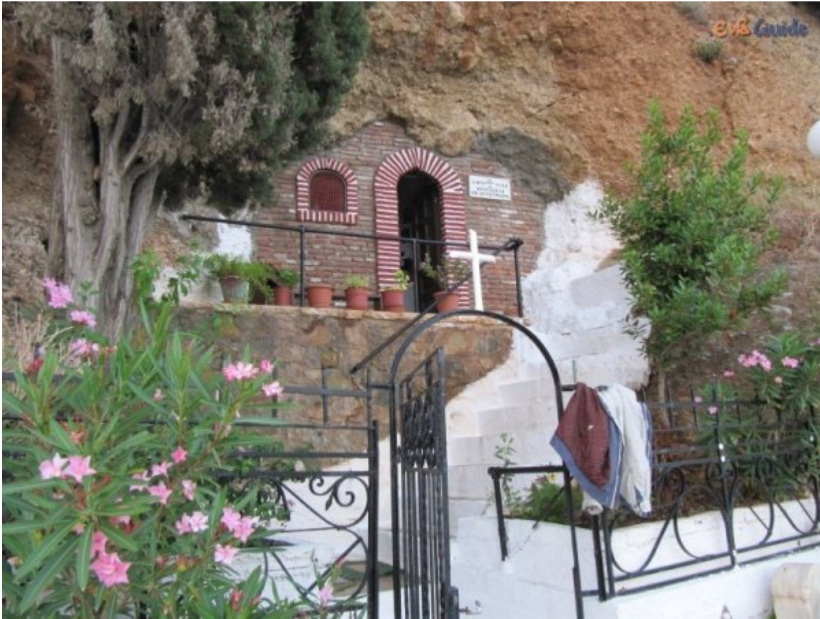
Ασκητήριο αγίου Χριστόδουλου στην Λίμνη Ευβοίας

Η διαμονή του Οσίου Χριστοδούλου στην Εύβοια ήταν σύμφωνα με επιστημονικές έρευνες μικρής διάρκειας. Υπάρχει η πληροφορία ότι ένας ευσεβής και πλούσιος κάτοικος του Ευρίπου προσέφερε την πολυτελή οικία του στον Όσιο, ο οποίος την ανέδειξε σε μοναστήρι, αν και οι φροντίδες του Οσίου, εξαιτίας της μεγάλης περιουσίας του μοναστηριού στην Πάτμο, απαιτούσαν την παραμονή του όχι στην έρημο αλλά κοντά στον κόσμο. Εξάλλου, στην Εύβοια ανέκαθεν υπήρχε παράδοση, σύμφωνα με την οποία ο Όσιος Χριστόδουλος παρέμεινε ασκητεύοντας στο σπήλαιο στο δυτικό άκρο της κωμόπολης Λίμνη (Ελύμνιον). ( περισσότερα... )