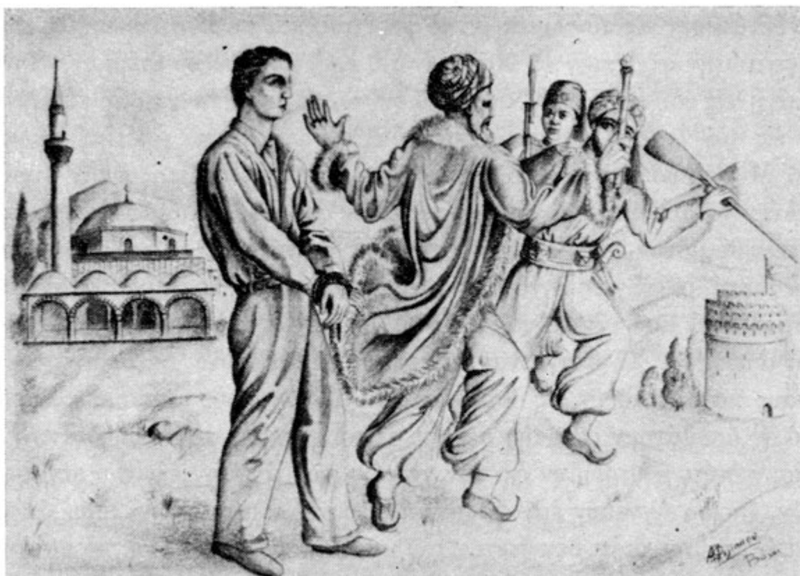
Τῇ θαυμαστῇ ἐπεμβάσει τοῦ Μεγαλομάρτυρος Ἁγ. Δημητρίου ὁ πασᾶς ἐλευθερώνει τὸν Κωνσταντῖνον, ὀδηγούμενον ὑπὸ τῶν δημίων εἰς θάνατον.