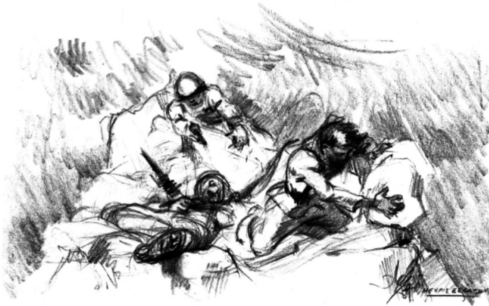
Μέχρις εσχάτων, Αλέξανδρου Αλεξανδράκη

«Μέχρις εσχάτων». Αυτός είναι ο τίτλος που έδωσε σε ένα έργο του, ο ζωγράφος του '40, Αλέξανδρος Αλεξανδράκης. Οι λεπτομέρειες των προσώπων, ίσως δεν διακρίνεται πολύ καλά στο σκίτσο. Στην αντίστοιχη ελαιογραφία όμως -σε ένα κλίμα έντονης ρεαλιστικής απόδοσης- διακρίνεται η τιτάνια προσπάθεια δύο Ελλήνων στρατιωτών που πολεμούν τον εχθρό, σκαρφαλωμένοι σ' ένα βουνό, ο ένας με περίστροφο στο χέρι κι ο άλλος -με βλέμμα όμοιο με αετού- είναι έτοιμος να εκσφενδονίσει ένα βράχο. Δίπλα τους κείτεται νεκρός, ένας συνάδελφός τους. Τα ρούχα τους είναι σκισμένα, τα χέρια έχουν ξυλιάσει, στα ταλαιπωρημένα πρόσωπά τους όμως διακρίνεται ένα άγριο πείσμα και μια αποφασιστικότητα: «Μέχρις εσχάτων».