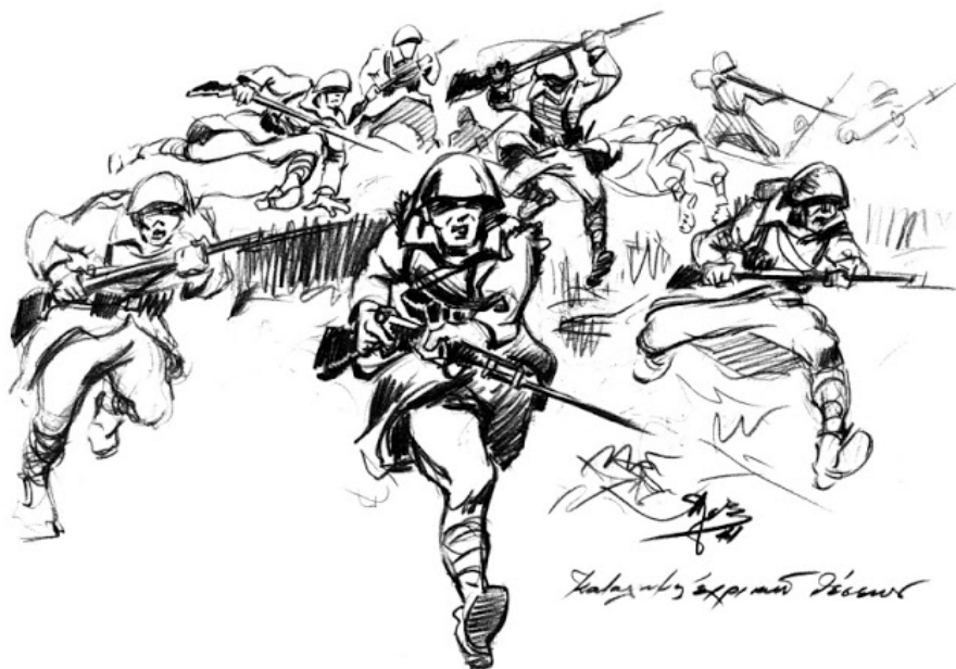
Κατάληψις εχθρικών θέσεων, Αλέξανδρου Αλεξανδράκη

Σπούδασε στη Σχολή Καλών Τεχνών κοντά στους Βικάτο, Αργυρό, Κεφαλληνό. Έλαβε σημαντικές διακρίσεις, ενώ πήρε μέρος στην Μπιενάλε της Αλεξανδρείας το 1955. Έργα του βρίσκονται στο Πολεμικό Μουσείο, στην Εθνική Πινακοθήκη, σε ιδιωτικές συλλογές στην Ελλάδα και το εξωτερικό.