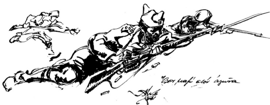
Όλοι μαζί στον αγώνα, Αλέξανδρου Αλεξανδράκη

Σπούδασε στη Σχολή Καλών Τεχνών κοντά στους Βικάτο, Αργυρό, Κεφαλληνό. Έλαβε σημαντικές διακρίσεις, ενώ πήρε μέρος στην Μπιενάλε της Αλεξανδρείας το 1955. Έργα του βρίσκονται στο Πολεμικό Μουσείο, στην Εθνική Πινακοθήκη, σε ιδιωτικές συλλογές στην Ελλάδα και το εξωτερικό.