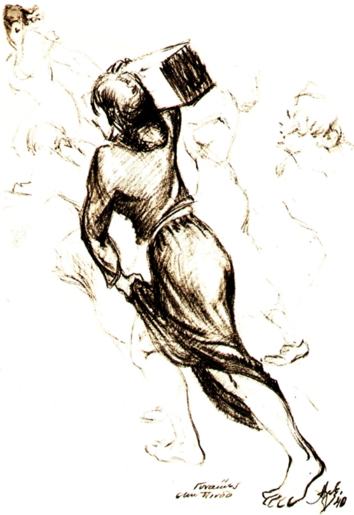
Γυναίκες της Πίνδου, Αλέξανδρου Αλεξανδράκη

Ο ζωγράφος Αλέξανδρος Αλεξανδράκης (ο παππούς του οποίου ήταν ιερέας και γραμματοδιδάσκαλος), έλαβε μέρος στον Ελληνο-ιταλικό Πόλεμο στο αλβανικό μέτωπο ως δεκανέας πυροβολητής. Είχε προλάβει το 1930, να κάνει την πρώτη του έκθεση στη Χριστιανική Αδελφότητα Νέων.