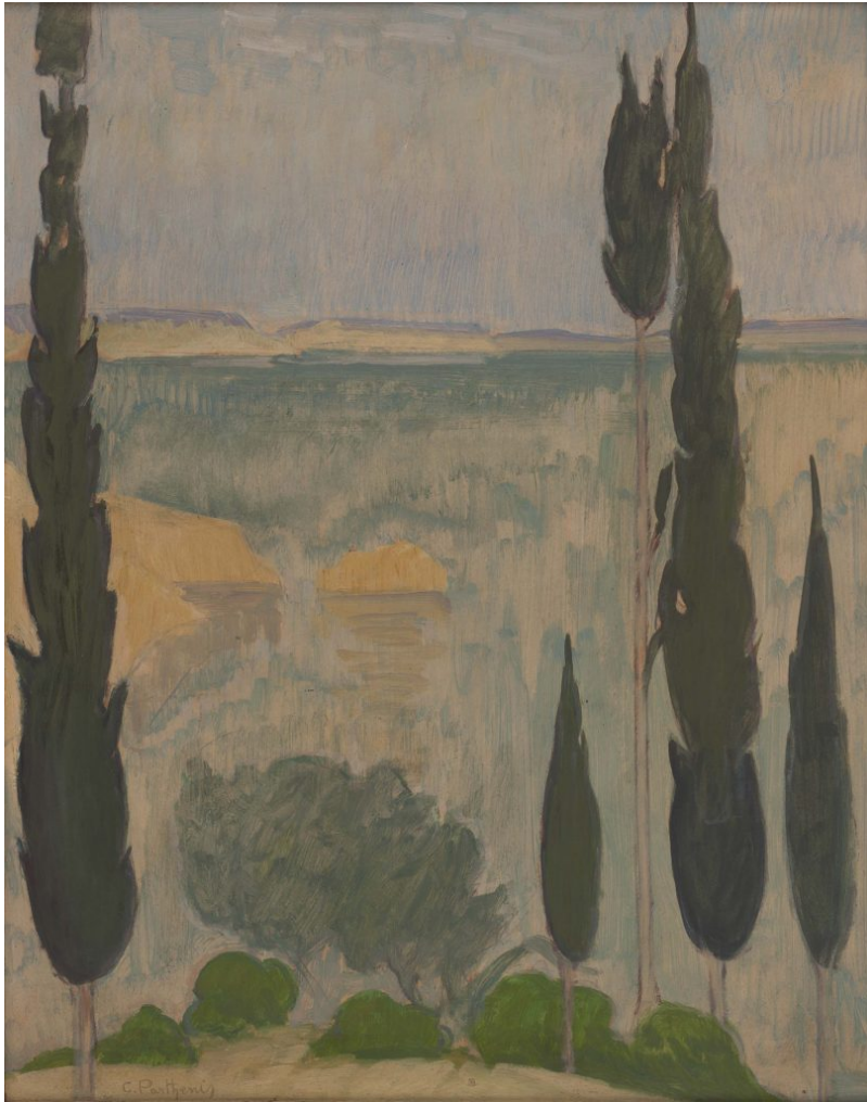
ΠΑΡΘΕΝΗΣ ΚΩΝΣΤΑΝΤΙΝΟΣ. Θάλασσα με κυπαρίσσια, 1925, Λάδι σε χαρτί. 65,3x52,3 εκ.

Η συλλογή αποτελείται από έργα ζωγραφικής και γλυπτικής, που χρονολογούνται από τον 19ο έως τον 20ο αι. Οι επιλογές αυτές, σε μεγάλο βαθμό, σχετίζονται με την προσωπικότητα των συλλεκτών Νέστορα και Αλίκης Τέλλογλου, οι οποίοι έθεσαν ως σκοπό της ζωής τους, την προσφορά στην παιδεία και τον πολιτισμό. Γι' αυτό το λόγο δώρισαν ολόκληρη τη συλλογή τους, που αποτελείται από 7000 έργα τέχνης και την περιουσία τους στο Α.Π.Θ. και το Τελλόγλειο Ίδρυμα.