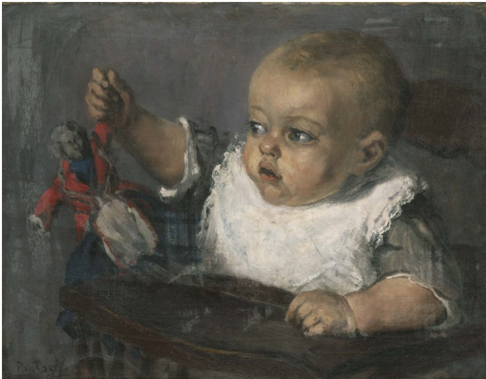
ΠΑΝΤΑΖΗΣ ΠΕΡΙΚΛΗΣ. Το παιδάκι με την κούκλα, 1875, Λάδι σε μουσαμά, 39x50 εκ.

«Στο χώρο των Καλών Τεχνών..., πάντα ένα αόρατο νήμα, συνδέει το παλιό με το καινούργιο, το γνώριμο με το άγνωστο, στοχεύοντας στην ουσία της δημιουργίας, της πνευματικής της κορύφωσης και της διαφύλαξης του άφθαρτου της ομορφιάς.