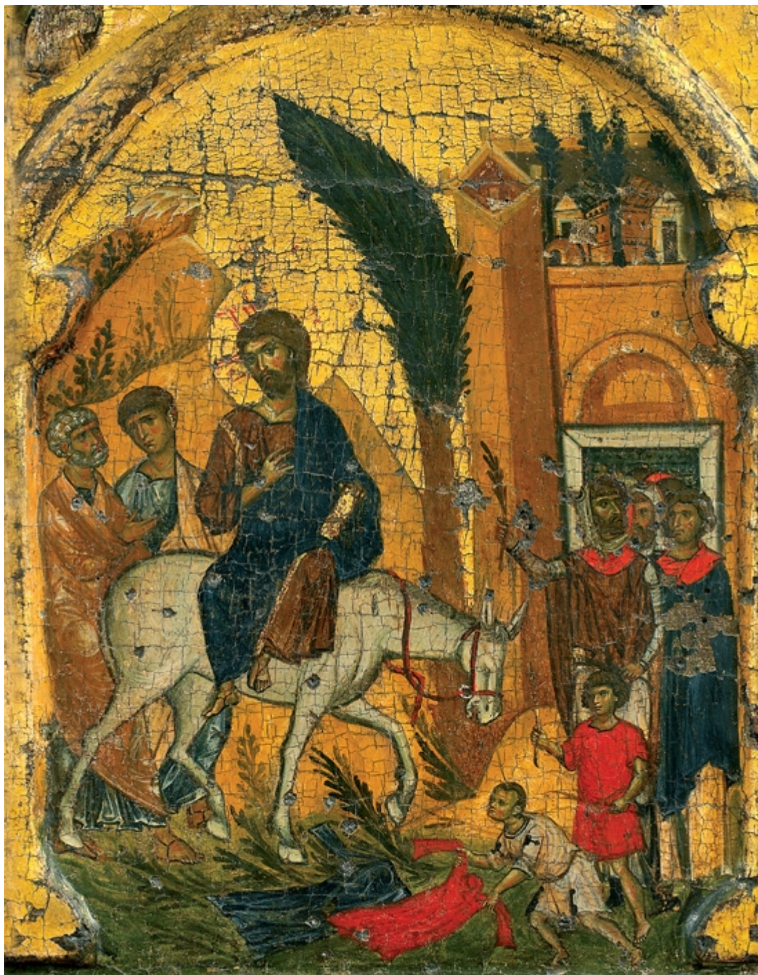
Η Βαϊϋόφορος, επιστύλιο τέμπλου, 12ος αι., Ιερά Μεγίστη Μονή Βατοπαιδίου, Άγιον Όρος

Περισσότερο στον άνθρωπο χρειάζεται η καλή τοποθέτηση των πραγμάτων στις δύσκολες αυτές μέρες πού βρισκόμαστε· με περισσότερη σύνεση να ανταποκριθή, γιατί, όπως ακούσαμε και στην ανάγνωση της τράπεζας «διά το πληθυνθήναι την ανομία», κατά τον λόγο του Κυρίου, «ψυγήσεται η αγάπη των πολλών».