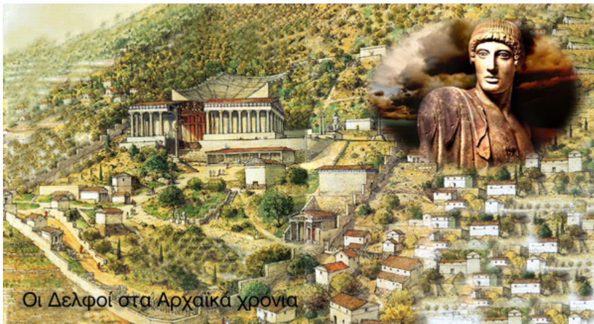
Οι Δελφοί στα Αρχαϊκά χρόνια

Η ομάδα έφτασε στο μαντείο των Δελφών. Ο Εμπεδοκλής μπήκε στο κτίριο με αγωνία. Μετά από λίγο βγήκε ανακοινώνοντας στους συντρόφους του την περιοχή της αποικίας τους: Σικελία. Η ομάδα δεν ξαφνιάστηκε. Πολλοί είχαν φύγει πριν από αυτούς με τον ίδιο προορισμό, τη Σικελία και την Κάτω Ιταλία και είχαν δημιουργήσει εκεί πολλές αποικίες. Για αυτό άλλωστε η περιοχή εκεί είχε ονομαστεί Μεγάλη Ελλάδα. Γύρισαν στη πόλη.