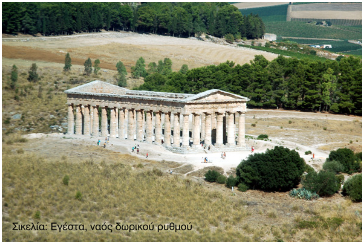
Σικελία: Εγέστα, ναός δωρικού ρυθμού

Παρήγορες ήταν αυτές οι σκέψεις για τον Εμπεδοκλή. Του έδωσαν νέα δύναμη. Άνοιξε το βήμα του. Κοίταξε την ομάδα του με χαμόγελο και τους έδωσε θάρρος. Μαζί με αυτή την ομάδα θα συμπορεύονταν και θα αντιμετώπιζαν τις δυσκολίες που θα παρουσιάζονταν στο δρόμο τους. Μαζί με αυτή την ομάδα θα δημιουργούσε την αποικία στη Σικελία.