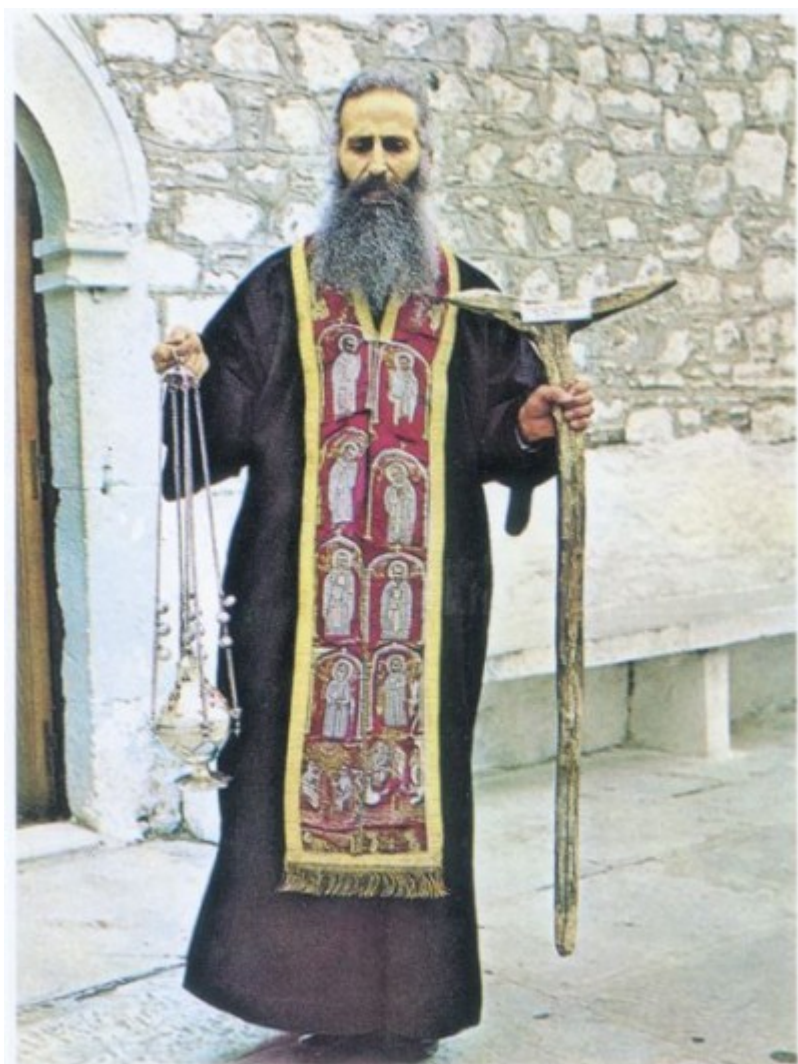
Ο Γέροντας Ιάκωβος, φορώντας τό πετραχήλι του Όσιου Δαβίδ κρατάει τό θυμιατό και τή Ράβδο του Όσιου (1976).

Ανταποκρινόμενοι στην ευγενική και φιλάδελφη πρόσκληση του εγκρίτου περιοδικού ΠΕΜΠΤΟΥΣΙΑ και παροτρυνόμενοι απ' την προτροπή του μακαριστού πλέον κι αυτού αγίου Γέροντος Παΐσιου, η οποία περιέχεται στον πρόλογο του βιβλίου του για τον Χατζη-Γιώργη, σύμφωνα με την οποία «οι απόγονοι πάντοτε έχουν ιερό καθήκον να γράφουν τα θεία κατορθώματα των αγίων Πατέρων της εποχής τους και τον φιλότιμο αγώνα τους για να πλησιάσουν τον Θεό», προσπαθήσαμε με τη βοήθεια του Θεού και επικαλούμενοι την ευχή του μακαριστού αγίου Γέροντος Ιακώβου, να γράψουμε, όσο το δυνατό πιο συνοπτικά, το κείμενο αυτό, το αφιερωμένο στη μνήμη του μακαριστού Γέροντος.