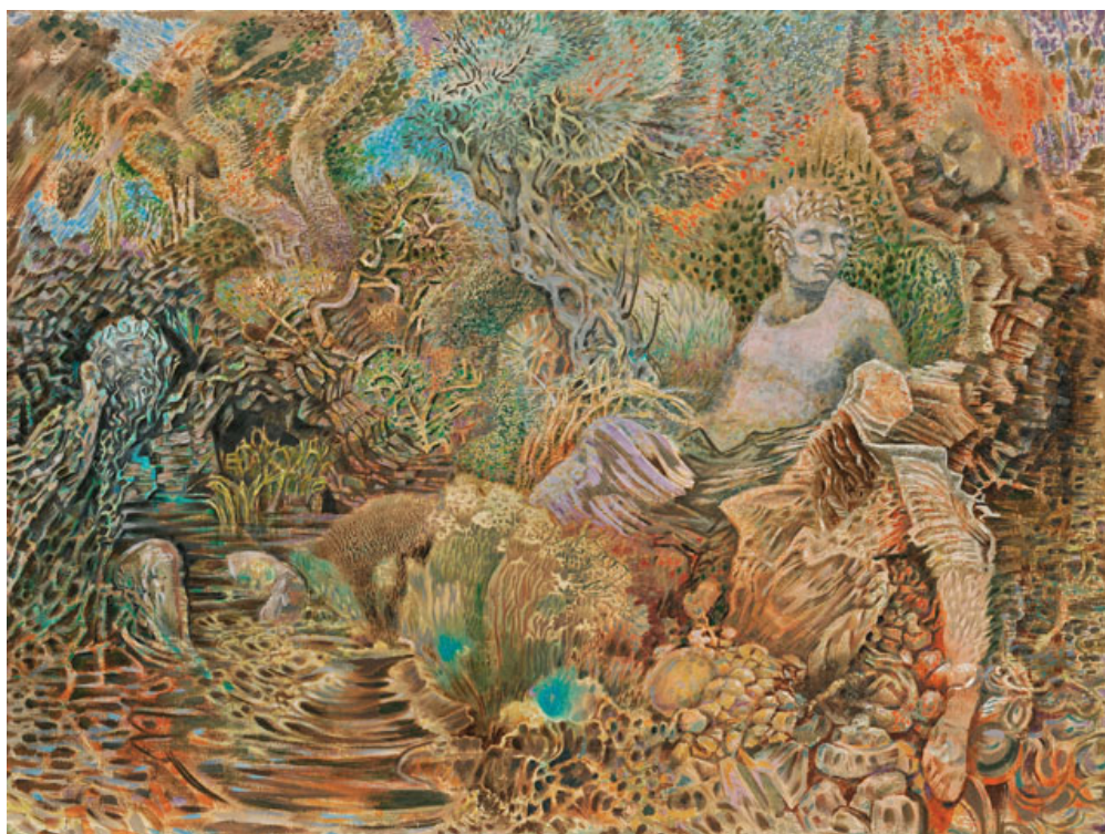
Νίκος Χατζηκυριάκος-Γκίκας (1906-1994) Genii Loci , 1970 Λάδι σε μουσαμά, 75,5 x

Η έκθεση δομείται εννοιολογικά, σε τρεις μεγάλες ενότητες. Η πρώτη πραγματεύεται την έννοια της ταυτότητας και το αίτημα της ελληνικότητας, όπως αυτό διατυπώθηκε τη δεκαετία του '30 και τη μεταπολεμική περίοδο.