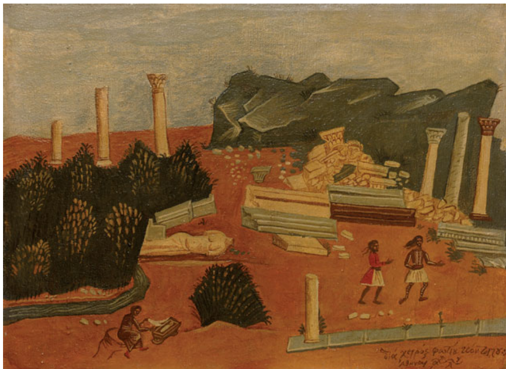
Φώτης Κόντογλου (1895/1896-1965) Η Ελλάδα των τριών κόσμων , 1933 Λάδι σε μουσαμά, 31,5 x 43 εκ. αρ. έργου 10515 Εθνική Πινακοθήκη - Μουσείο Αλεξάνδρου Σούτζου

Στόχος της έκθεσης είναι, να αναδείξει τη βιωματική και πνευματική σχέση των καλλιτεχνών με τον τόπο, καθώς και τον τρόπο με τον οποίο, μέσω της καλλιτεχνικής έκφρασης, ο τόπος φορτίζεται με ένα πλήθος νοημάτων και συμβόλων, που προβάλλουν την ιδιαιτερότητά του και καθορίζουν το πνεύμα, τον χαρακτήρα και την ψυχή του.