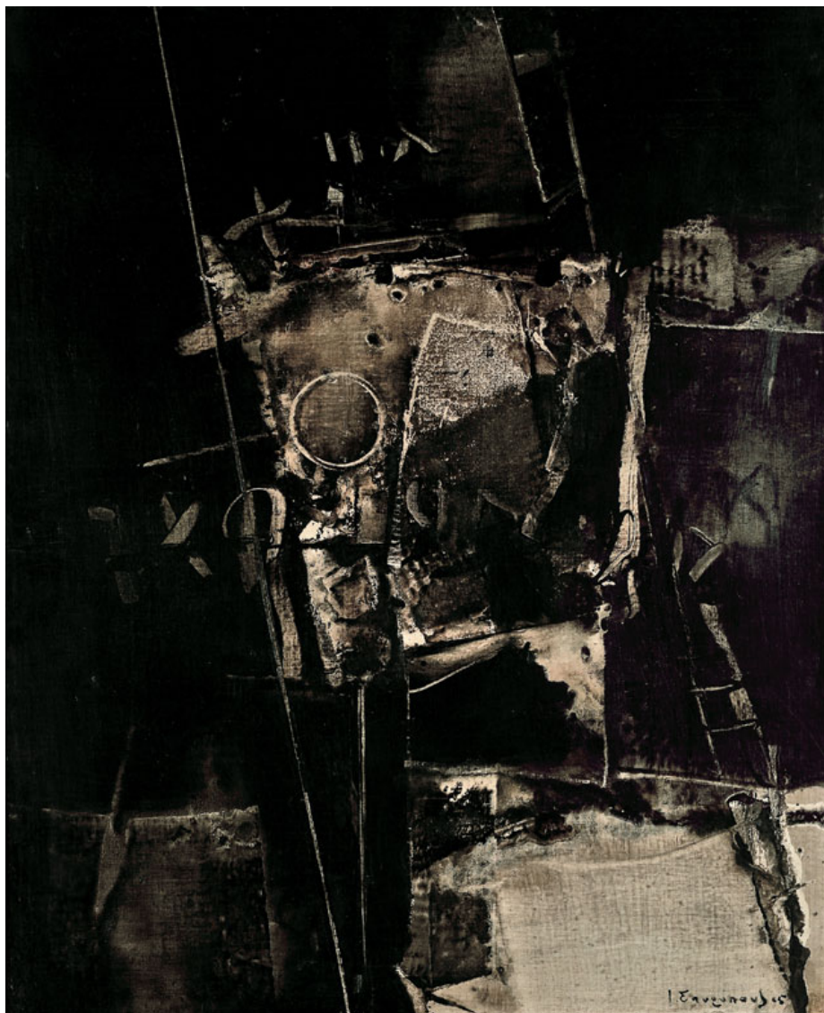
Γιάννης Σπυρόπουλος (1912-1990) Ο,τι απέμεινε , 1973 Λάδι σε μουσαμά, 65 x 54 εκ. Δωρεά Υπουργείου Πολιτισμού και Επιστημών αρ. έργου 4385 Εθνική Πινακοθήκη - Μουσείο Αλεξάνδρου Σούτζου