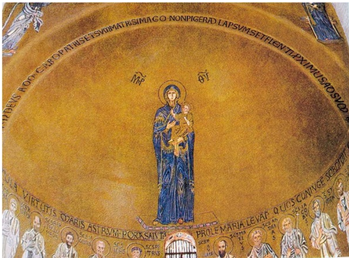
Εικ.13: Ψηφιδωτό, Santa Maria Assunta, Torcello, 12ος αι.

Το χρυσό δίνει παράλληλα την αίσθηση του άχρονου και του άχωρου. Αγκαλιάζει και προβάλλει ταυτόχρονα τη μορφή αφού πρώτα την λούσει μέσα στο φως όπως πολύ χαρακτηριστικά βλέπουμε σε δύο περίφημα ψηφιδωτά στο Torcello της Βενετίας και στην Αγία Σοφία στο Κίεβο [εικ.13-14].