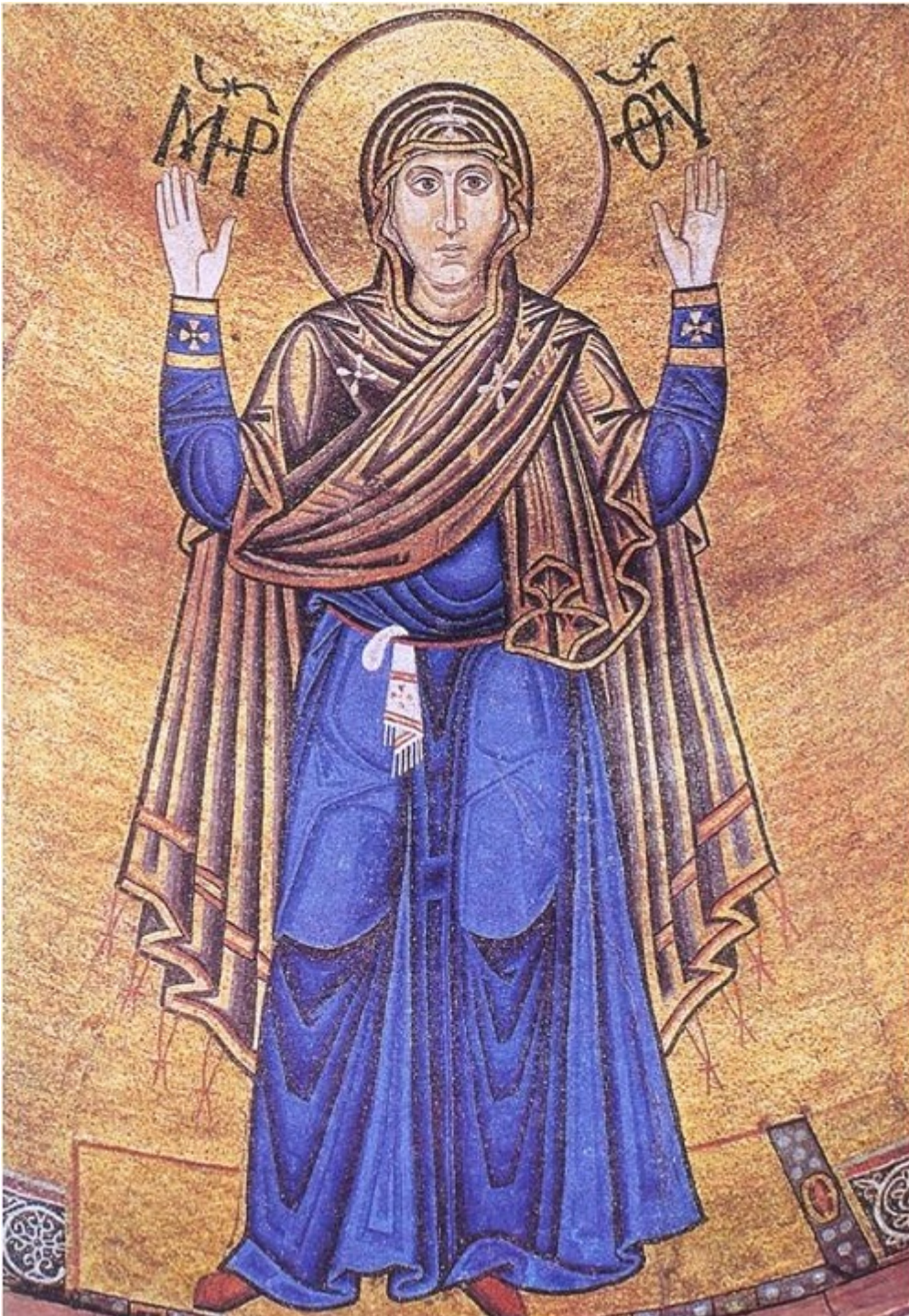
Εικ.14: Ψηφιδωτό, Αγία Σοφία, Κίεβο, μέσα 11ου αι.

Το χρυσό στον κάμπο, στα φωτοστέφανα και στα ενδύματα αντιφεγγίζει το φυσικό φως του ήλιου με διαφορετική ένταση ανάλογα με την ώρα της ημέρας ενώ, όσο σβήνει η μέρα, τα κεριά χαϊδεύουν τα φώτα στα ενδύματα και στα πρόσωπα και γλυκαίνουν τις μορφές. Οι μορφές πλάθονται με το φως και τη σκιά. Κάθε πρόσωπο ακτινοβολεί το δικό του φως, ορατό σημείο της κοινωνίας του Αγίου με το Θείο [εικ.15]. Το φως αυτό δεν είναι άλλο από τη λαμπάδα της πίστης που φλογίζει τις καρδιές των εικονιζομένων αγίων και βρίσκει διέξοδο στα πρόσωπά τους. Διότι το φως αυτό εκπορεύεται από τον Τριαδικό Θεό και δεν είναι δυνατόν να κατανοηθεί