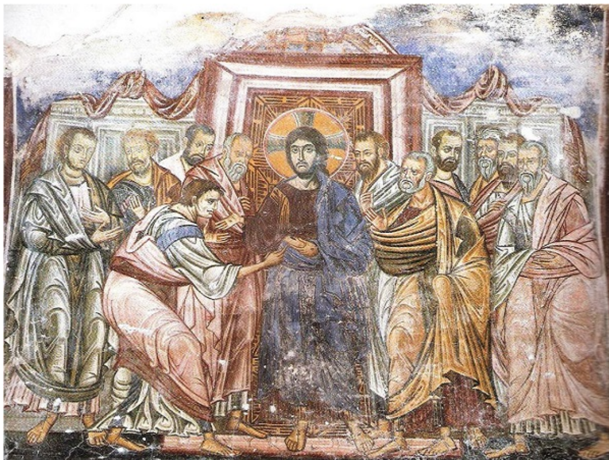
Εικ.11: Τοιχογραφία, καθολικό Μονής Βλαχέρνας, Άρτα, μέσα 13ου αι.

Οι βυζαντινοί καλλιτέχνες είναι γνωστό ότι διακρίθηκαν στην τέχνη του ψηφιδωτού. Αυτό το είδος της ζωγραφικής αναδεικνύει καλύτερα από κάθε άλλο μέσον το πώς οι βυζαντινοί αντιλαμβάνονταν το φως. Το ψηφιδωτό είναι φως αλλά όχι το φυσικό. Δέχεται το φυσικό φως αλλά το μετουσιώνει στο φως το απρόσιτο. Ψηφιδωτά απaráμιλλης τέχνης όλων των εποχών αποκαλύπτουν τα μυστικά των ψηφιδογράφων όταν αυτοί, σε κοίλες ή επίπεδες επιφάνειες, αναζητούν εναγωνίως την κατάλληλη κλίση για να πακτώσουν τη γυάλινη ψηφίδα έτσι ώστε αυτή δεχόμενη το φυσικό φως να το αντανακλά και να το διαχέει σε όλο τον ναό.