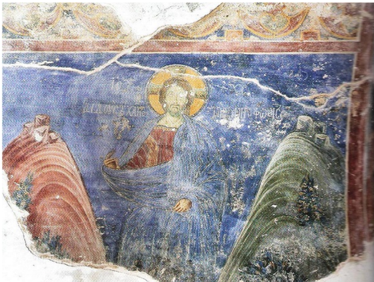
Εικ.12: Τοιχογραφία, καθολικό Μονής Βλαχέρνας, Άρτα, μέσα 13ου αι.

Εδώ αρμόζει να θυμηθούμε την περιγραφή του Προκόπιου για το μεγαλειώδες έργο του Ιουστινιανού, τον ναό της Αγίας Σοφίας «φαίης ἂν οὐκ ἔξωθεν καταλάμπεσθαι ἠλίω τόν χῶρον, ἀλλά τήν αἴγλην ἐν αὐτῷ φύεσθαι, τσαύτη τις φωτός περιουσία ἐς τοῦτο δὴ τό ἱερόν περικέχυται». Ο Ιουστινιάνειος εντοίχιος διάκοσμος του ναού ήταν ψηφιδωτός ανεικονικός. Κυριαρχούσε όμως το χρυσό χρώμα και αυτό μέσα από την πολυμορφία των επιμέρους δομικών στοιχείων ευθύγραμμων, τοξωτών, καμπύλων, τρουλωτών, οριζόντιων, κατακόρυφων, ήταν η περιουσία του φωτός για τον ναό.