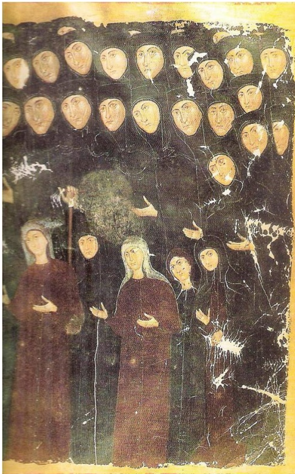
Εικ.15: Τυπικό Μονής Θεοτόκου της Βεβαίας Ελπίδος, Κωνσταντινούπολη, 1327-1342, Oxford Lincoln College.

παρά μόνον μέσα στην εσχατολογική προοπτική της Εκκλησίας.