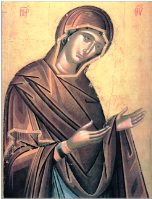
Παναγία δεομένη - Μεγάλης Δεήσεως - ἔτος 1542

Ὁ συγκεκριμένος φυσιογνωμικὸς τύπος τῆς Παναγίας, μὲ τὴ γλυκύτητα τῆς μελαγχολικῆς ἔκφρασης, καὶ ἡ τεχνικὴ τῆς ἐκτέλεσης ἔχουν καὶ πάλι τὴν καταγωγή τους στὴ ζωγραφικὴ τοῦ Ἀγγέλου, ὅπως μπορούμε νὰ τὸ διαπιστώσουμε, συγκρίνοντας τὴν Παναγία τῆς Μεγάλης Δεήσεως μὲ τὴν Παναγία ἀπὸ τὴ Δέηση τοῦ Ἀγγέλου στὴν Ἁγία Μονὴ Βιάννου τῆς Κρήτης.