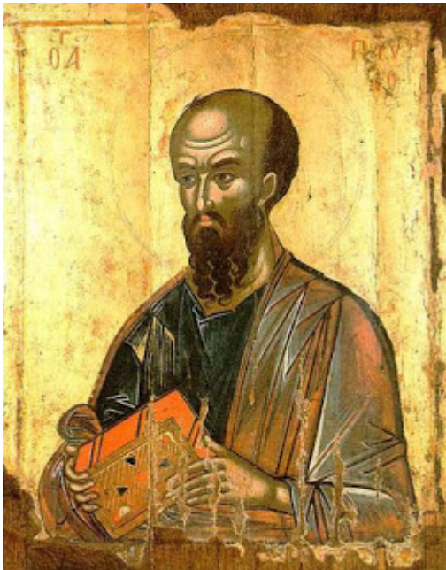
Ο 'Απόστολος Παύλος ( 1542 ).

«Όπως παρετήρησεν ήδη ό Χατζηδάκης, τα πρότυπα τού Ευφρόσυνου πρέπει ν' αναζητηθούν εις τα έργα της Μακεδονικής σχολής τών χρόνων τών Παλαιολόγων. Τούτο είναι απολύτως, νομίζω, βέβαιον. Είδομεν πράγματι διτι ό 'Απόστολος Παύλος τού Ευφρόσυνου σχετίζεται προς παλαιολογείους τοιχογραφίας τών αρχών τού 15 ου αιώνας. Άλλα και ως προς την τεχνικήν ούτος, μέ τήν διάλυσιν τών εντόνως φωτιζόμενων επιφανειών εις παραλλήλους γραμμάς ακολουθούσας το σχήμα του όγκου, συνεχίζει, κατά τίνα τρόπον, τήν παλαιολόγειον παράδοσιν, εις τήν οποίαν όμως δίδει νέον περιεχόμενον, περισσότερον αύστηρόν.