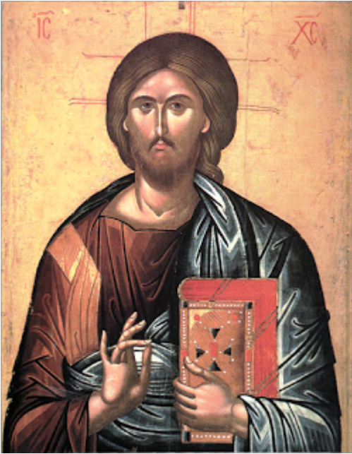
Ιησούς Χριστός - Μεγάλης Δεήσεως- έτος 1542

Ο Ευφρόσυνος, γνωστός μόνο από τις πέντε εικόνες της Μεγάλης Δέησης της μονής Διονυσίου, εμφανίζεται με την τέχνη του ζωγράφου σημαντικός, σύγχρονος του Θεοφάνη Μπαθά, αντιπροσωπεύει όμως ροπή διάφορη της κρητικής ζωγραφικής. Η υπόθεση ότι ανήκει στην οικογένεια των ζωγράφων Κλόντζα είναι αστήρικτη, γιατί για το μνημονευόμενο σε έγγραφο του 1567 ως ποτε παπα κυρ Ευφρόσυνο Κλόντζα δεν υπάρχει καμιά ένδειξη ότι ήταν ζωγράφος.