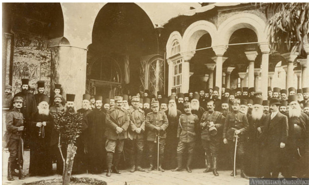
Ελληνες αξιωματικοί και άλλοι αξιωματούχοι με μοναχούς έξω από τη Μονή Βατοπαιδίου.

Εξόντωσε την συμμορία του ληστή Τρομάρα, που λυμαινόταν την περιοχή Ζαγκλιβερίου και Πετροκεράσων (Ραβνά), καθώς και μια συμμορία εξαρχικών. Ο Μινόπουλος συνεργάστηκε με τους μοναχούς της Ι. Μ. Δοχειαρίου και συνέταξε κατάλογο αγωνισθέντων στον Μακεδονικό Αγώνα, που σήμερα βρίσκεται στα Αρχεία του ΓΕΣ/ΔΙΣ.