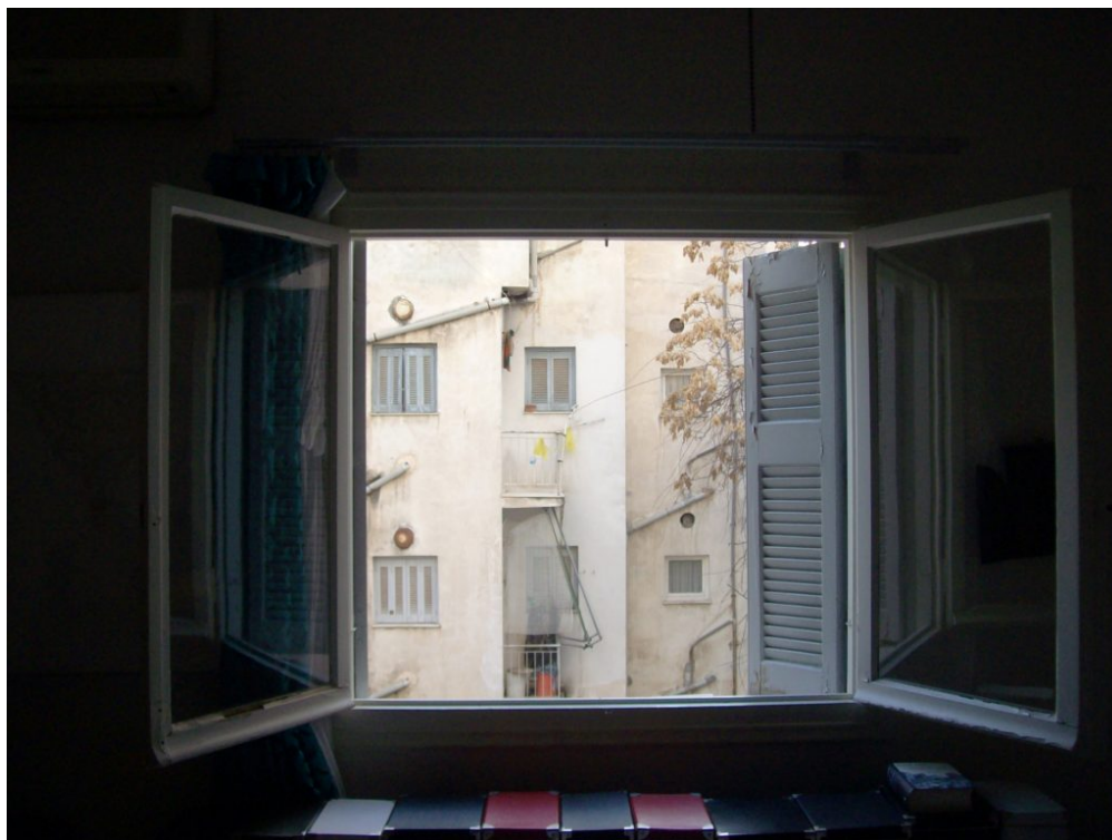
Νίκος Σταυρακαντωνάκης, Κυψέλη

Παρατηρώντας τις φωτογραφίες, το αστικό τοπίο φαίνεται σαν πίνακας ζωγραφικής. Το παράθυρο είναι το κάδρο της θέας και η έκθεση αυτή συνδυάζει «ζωγραφική» και φωτογραφία. Έτσι δημιουργείται μια νέα καταγραφή της πόλης, όπου ο συμμετέχων είναι ταυτόχρονα συνδημιουργός αλλά και θεατής.