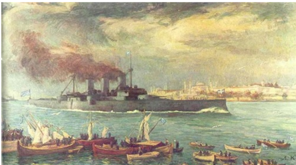
Το θωρηκτό «Αβέρωφ» στην Κωνσταντινούπολη το φθινόπωρο του 1918

Κατά το έτος 1921 το Θωρηκτόν «Αβέρωφ» (Θωρηκτό της Νίκης για τους Έλληνες και «διαβολοβάπορο» [σεϊτάν παπόρ] για τους «αθαλάσσωτους εξ ανατολών γείτονας») βρισκόταν στη θαλάσσια περιοχή της Κων/πόλεως εκτελώντας περιπολίες στην Προποντίδα και στη Μαύρη Θάλασσα. Υπενθυμίζεται ότι με τη λήξη του πρώτου Παγκοσμίου Πολέμου ο επικρατήσας συμμαχικός στόλος («Μοίρα του Αιγαίου») είχε εισπλεύσει στη Θάλασσα του Μαρμαρά και το Βόσπορο μαζί με το εμβληματικό σκαρί του «Αβέρωφ»[3].